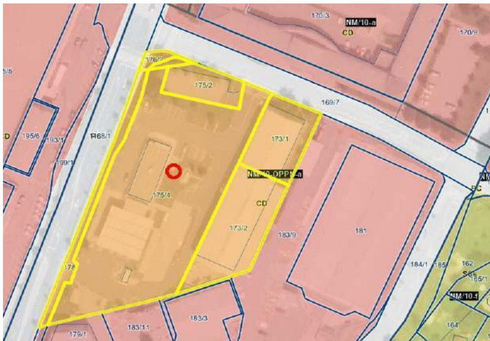
Slika 1: Območje sprememb in dopolnitev

V območje urejanja, ki je predmet sprememb in dopolnitev UN Bršljin (v nadaljevanju: SD UN) bo vključena ureditvena enota P5 – 1. del, ki zajema zemljišča parc.št. 176/2, 178, 176/1, 175/2, 173/1, 173/2, 175/4, vse k.o. 1456 Novo mesto, v velikosti 8 232 m 2 .