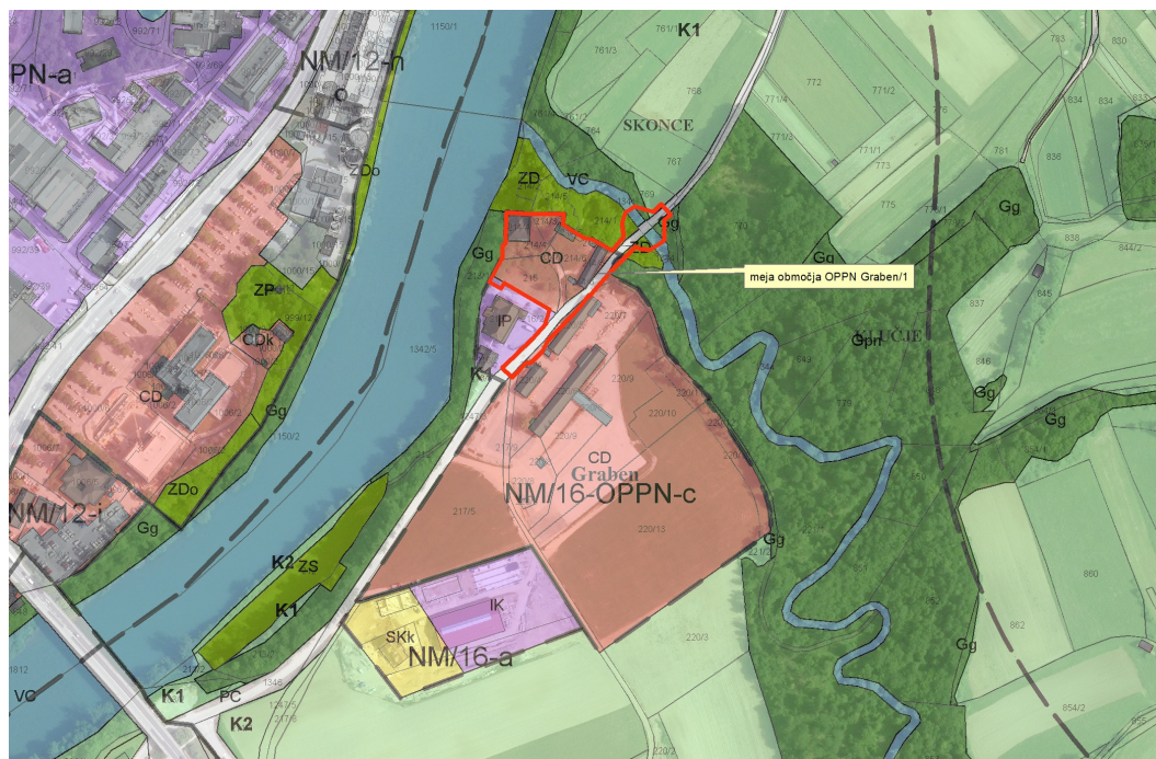
Slika 1: Izsek iz OPN: Območje EUP NM/16-OPPN-c s prikazom območja OPPN Graben/1

Območje predvidenega OPPN je določeno z Občinskim prostorskim načrtom Mestne občine Novo mesto (Uradni list RS, št. 101/09, in nadaljnji; v nadaljevanju: OPN) kot del enote urejanja prostora (EUP) z oznako NM/16-OPPN-c. Na pobudo investitorja se izdelava OPPN Graben/1 v manjšem obsegu od predvidenega po OPN. Območje OPPN Graben/1 se nahaja na severovzhodnem delu Novega mesta, vzhodno od glavne ceste II. reda Novo mesto – Metlika, ob lokalni cesti Ragovo – Krka – Smolenja vas.