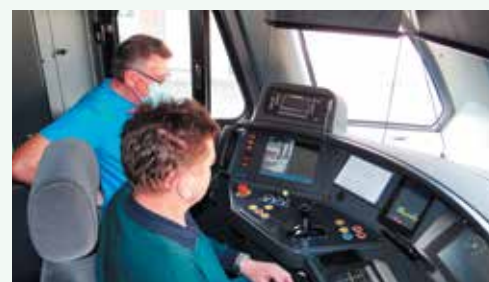
Pogled v vozniško kabino novega vlaka.