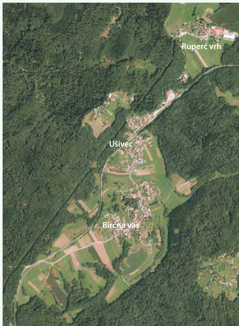
Birčna vas danes.

Zanimivo je, da so v centru vasi pred več kot sto leti zgradili vaško šterno, v katero se je stekala voda s streh bližnjih hiš