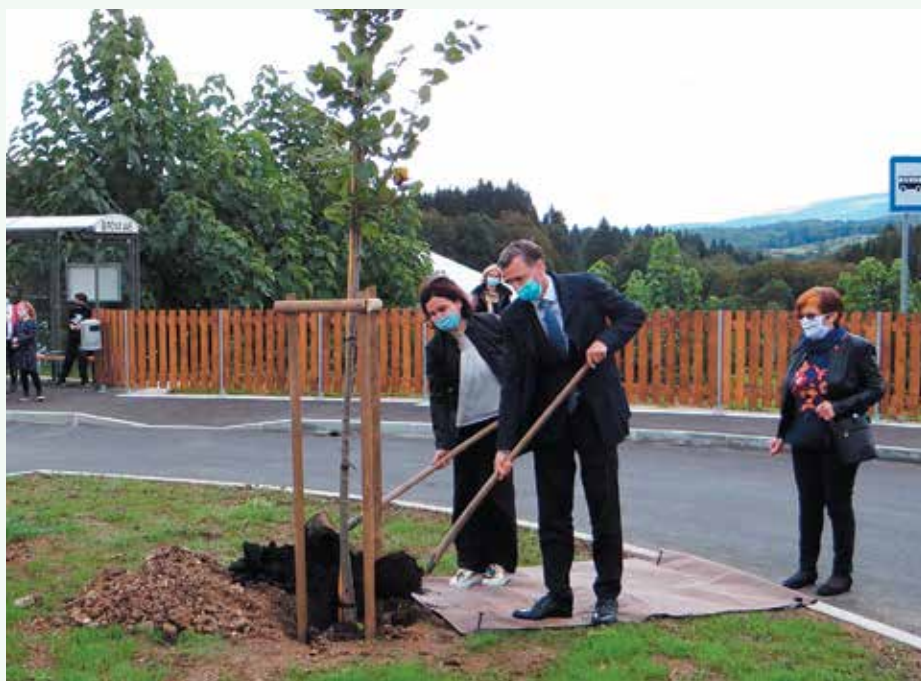
Posajena lipa za druženje.