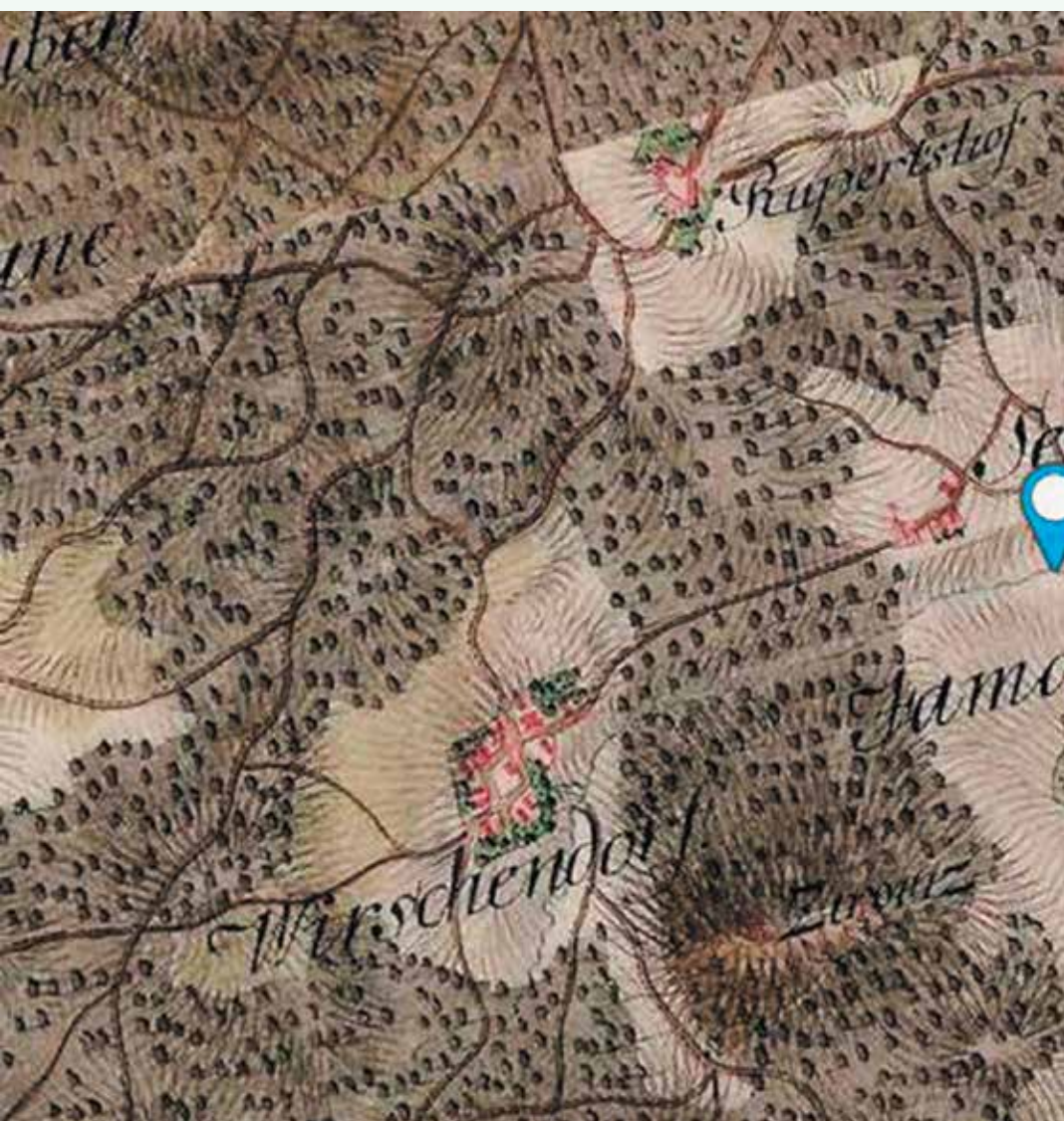
Birčna vas v 18. stoletju.

– kapelici, ki ob takratnem vhodu v vas stojita še danes.