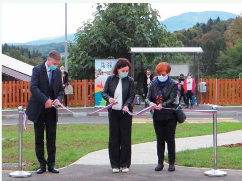
Trak je prerezan.