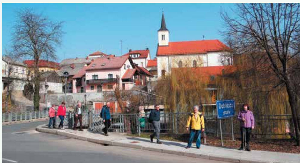
Ob reki Dobljčici v Črnomlju.

Člani pohodniške skupine Društva upokojencev Novo mesto – poverjenišтва Birčna vas smo že lani pridobili kartice za integrirani javni potniški prevoz, ki upokojencem omogoča brezplačno storitev. V svoje pohodne aktivnosti smo vključili to možnost prevoza do izhodišča pohoda. Uresničitev smo dočakali po ponovni sprostitvi