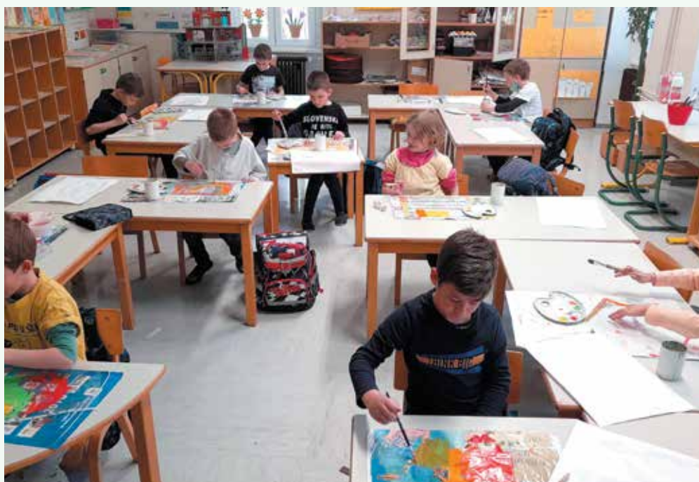
Prvošolci ponovno v šoli

To izobraževanje na daljavo se je začelo septembra 2020, ko se je koronavirus tako razširil po svetu, da se pouk ni mogel več izvajati v šolah. Potem pa smo pristali tukaj na izobraževanju na daljavo in res mi ni bilo prav nič všeč. Nisem mogla v živo videti prijateljev in učiteljic, nekateri pa so imeli težave z internetno povezavo in zato nam je bilo včasih težko delati za šolo. Vseeno moram priznati, da je bilo to izobraževanje polno novih, težkih in zabavnih izzivov. Naučila sem se uporabljati računalnik, sedaj imam svojo elektronsko pošto in na spletu sama najdem veliko poučnih vsebin. Na začetku smo upali, da se bomo od doma učili le nekaj tednov, na koncu pa se je zavleklo na dolge štiri mesece. Prav zato smo se vrnitve v šolo in srečanja z učiteljicami in sošolci še toliko bolj razveselili. Upam, da nam ne bo nikoli več treba na izobraževanje na daljavo.