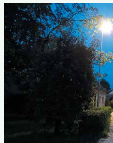
Osvetljen center vasi

Po ljudskem izročilu naj bi potok pod vasjo v času kuge služil kot »razkužilo«, saj je vsak prišlek moral čez potok v vas. V tem času sta bili postavljeni tudi kužni znamenji