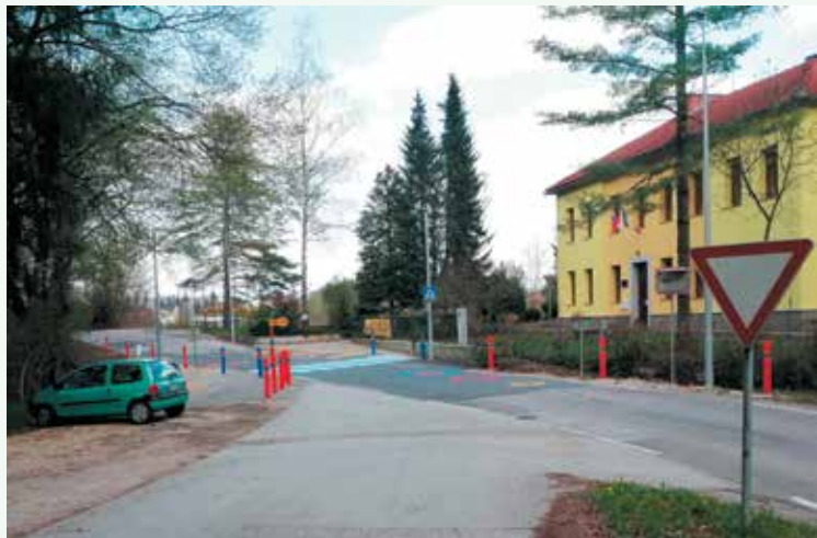
Nova ureditev prometa pri šoli.

Ko se ozremo nazaj v leto 2020 in tudi del leta 2021, lahko rečemo, da je bilo to obdobje posebno, a nam je dalo tudi nove izkušnje in priložnosti.