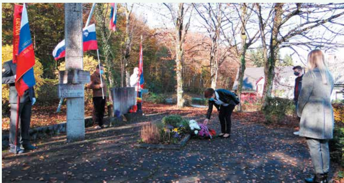
Počastitev ob dnevu spomina na mrtve.