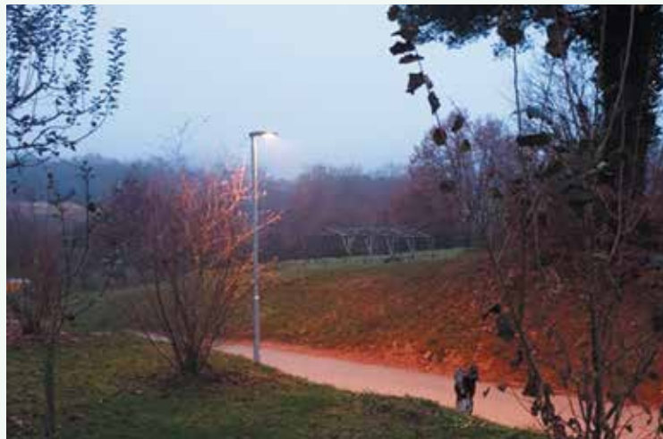
Prve luči v vasi Jama.

Napeljava širokopasovnega optičnega omrežja je v delu KS že izvedena. V vaseh Rajnovšče, Rakovnik, Jama, Lakovnice in delu