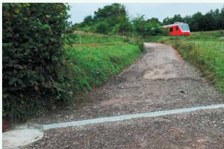
Ureditev odvodnjavanja v Birčni vasi.

Stranske vasi optika »že deluje«, drugod pa so stvari zaradi različnih vzrokov še v delu. V tem obdobju smo vsi občutili, kako pomembna je dobra internetna povezava, saj se je velik del aktivnosti preselil na splet.