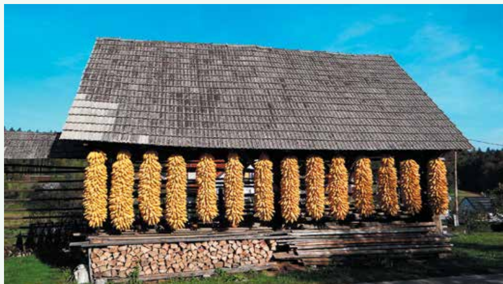
Počitek za oči in spomin.