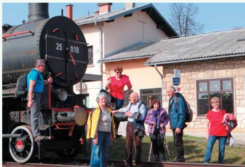
Tja s »kanarčkom«, tam smo si ogledali zgodovinsko »čihačuho«, nazaj pa z »modrinčkom«.