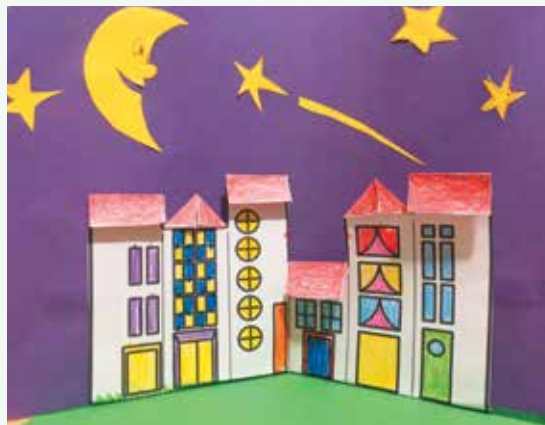
Uglješa Zmijanac, 3. r.