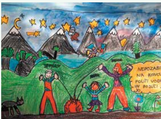
Teja Kralj Božič, 2. r.