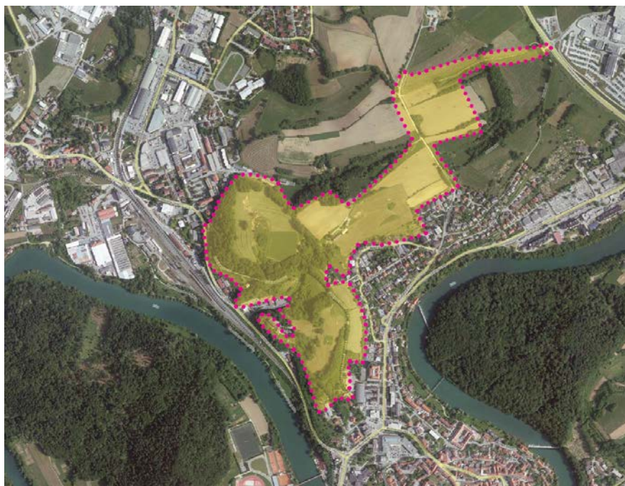
Slika: Prikaz širšega območja Arheološkega parka Situla (podlaga: DOF, GURS)

Namen Arheološkega parka Situla je krepitev lokalne in regionalne identitete z bogato dediščino in nadgradnja svetovno prepoznavnih dosežkov t.i. »Cvetočega dolenjskega halštata« s premišljeno, celostno in prepoznavno mestno trženjsko znamko. V aktivnosti za realizacijo projekta so poleg Mestne občine Novo mesto aktivno vključeni še Razvojni center Novo mesto, Dolenjski muzej Novo mesto in Zavod za varstvo kulturne dediščine Slovenije - OE Novo mesto.