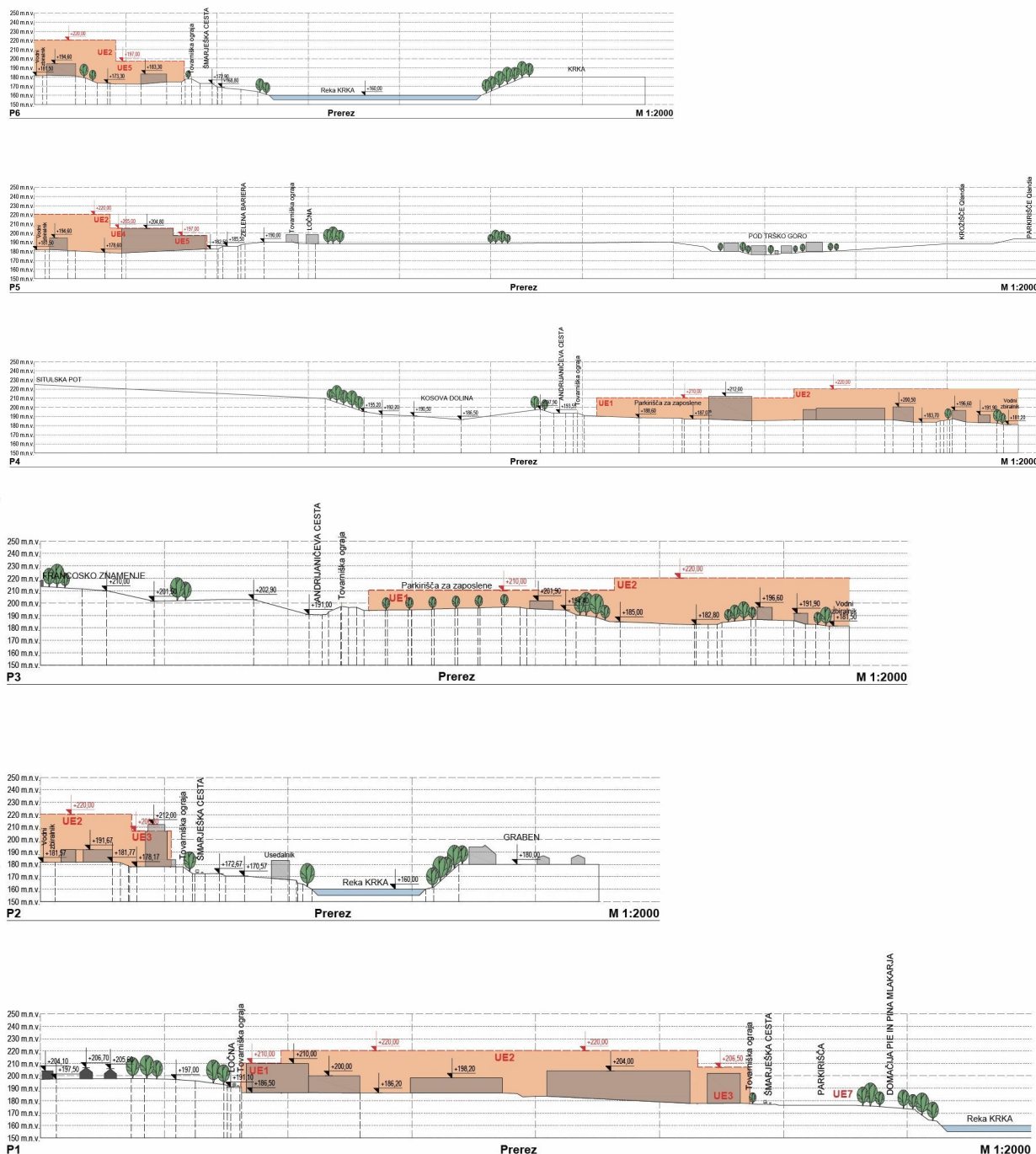
Slika 3: Značilni prerezi (Acer d.o.o. Novo mesto)

območju. Podlage so nastale ob upoštevanju razvojnih potreb Tovarne zdravil Krka, pa tudi podatkov o obstoječem stanju, prostorskih danostih in omejitvah v prostoru. Preverjena in upoštevana so bila tudi določila veljavnega OPN. Glede na to, da ima območje tovarne zaradi lege in zaradi velikih razsežnosti pomembno vlogo v prostorski sliki Novega mesta, so bile še posebej pozorno preverjene pomembnejše vizure in vpliv predvidenih ureditev na njih. Vse nove ureditve so načrtovane tako, da se zasnova organizacije dejavnosti in namenska raba območja OPPN ne spreminjajo.