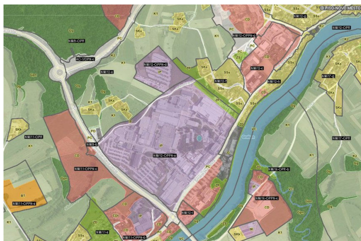
Slika 1: Izsek iz OPN MONM

Predmet občinskega podrobnega prostorskega načrta Tovarna zdravil Krka-1 (v nadaljevanju OPPN) je območje industrijskega kompleksa Krke, tovarne zdravil, d.d., ki se je kot gospodarska družba na območju urejanja začela razvijati s preselitvijo dela proizvodnih dejavnosti iz mestnega jedra Novega mesta v letu 1960 po izgradnji ceste bratstva in enotnosti Lj-Zg-Bg. Z uspešnim poslovanjem se je širilo tudi območje tovarne, ki se je še posebej na vzhodni strani (Ločna, Mačkovec) že precej približalo stanovanjskim predelom. Zato se je v zadnjem obdobju intenzivno izrabljajal razpoložljiv prostor znotraj območja urejanja.