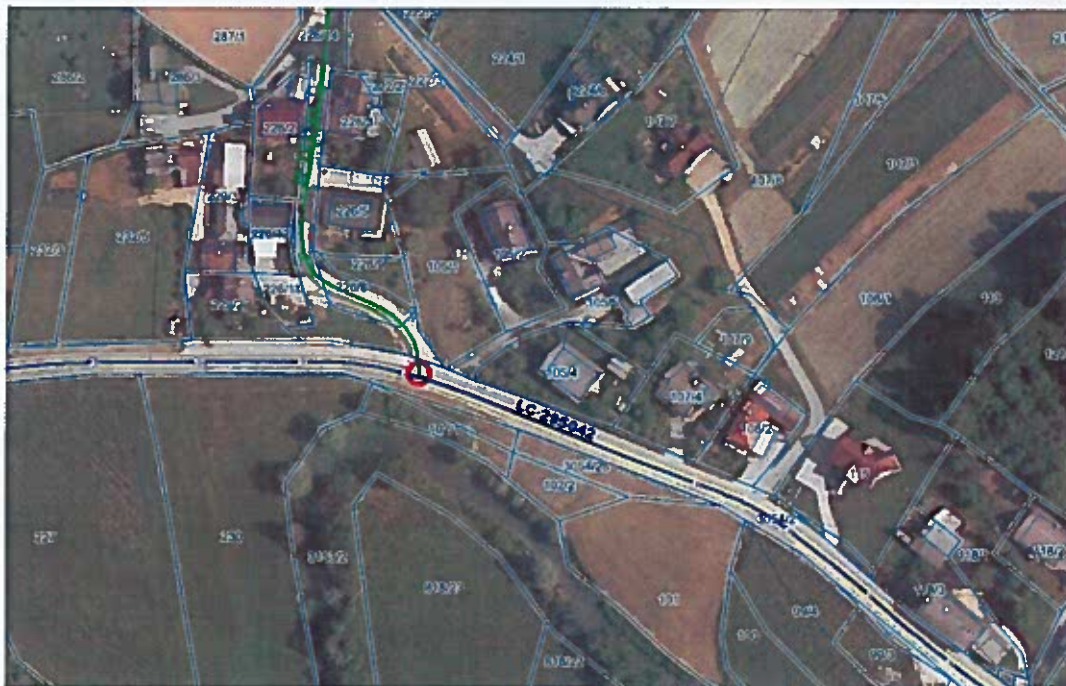
Slika 1: priključek JP 791721, Prečna – Kuzarjev Kal na LC 295042, Prečna; območje ureditve para avtobusnih postajališč in prehoda za pešce

Ureditev para avtobusnih postajališč in prehoda za pešce na občinski cesti LC 295042, v naselju Prečna, na delu od km 1,500 do km 1,635.