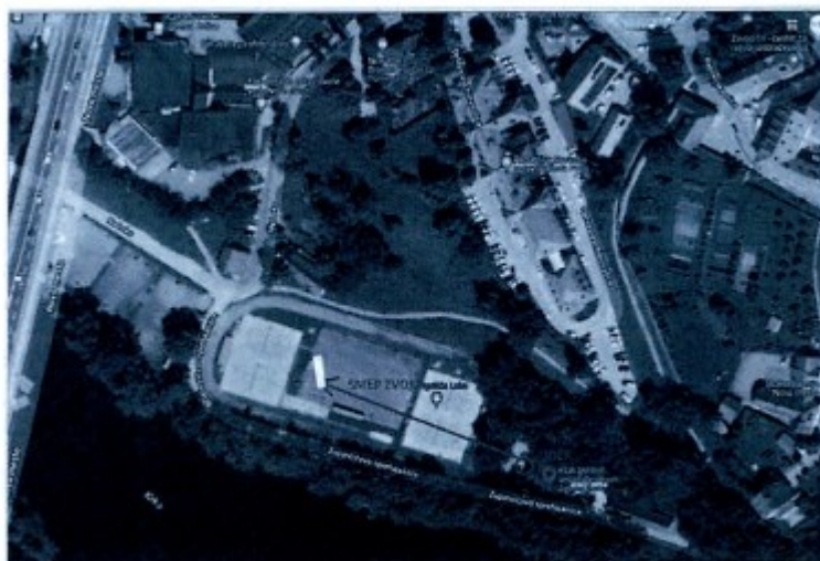
Slika 1: Prikaz postavitve obravnavanega objekta.