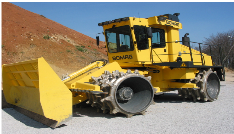
Slavnostna predaja kompaktorja Bomag tip BC 672 RB, CeROD, 6.4.2005