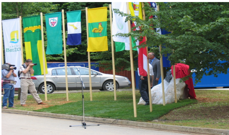
Položitev temeljnega kamna pri vhodu v CeROD (odlagališče Leskovec), 14.6.2005