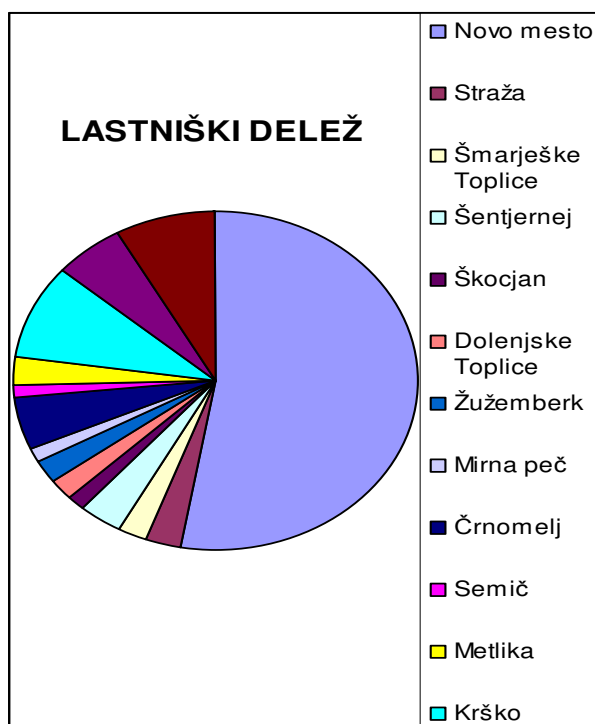
Graf 1: Lastniški deleži občin