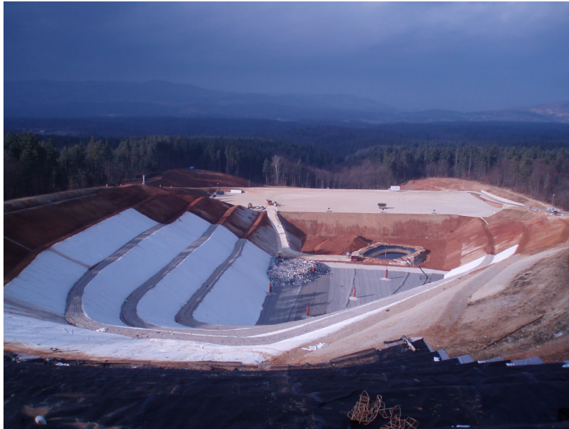
Center za ravnanje z odpadki Dolenjske – CeROD I (pričetek uporabe novega dela odlagališča)