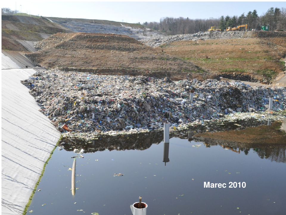
Sliki 1 in 2: Prikaz zapolnjevanja, fotografiji deponije iz novembra 2008 in marca 2010