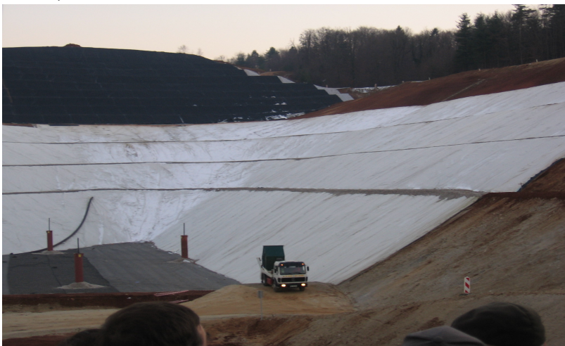
Svečana otvoritev novega dela odlagališča in začetek obratovanja CeROD I, 31.1.2007