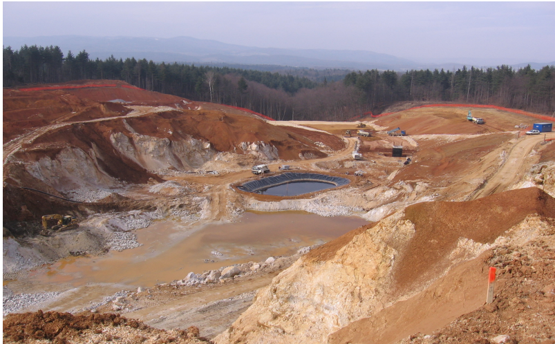
Priprava sklede novega dela odlagališča, marec 2006