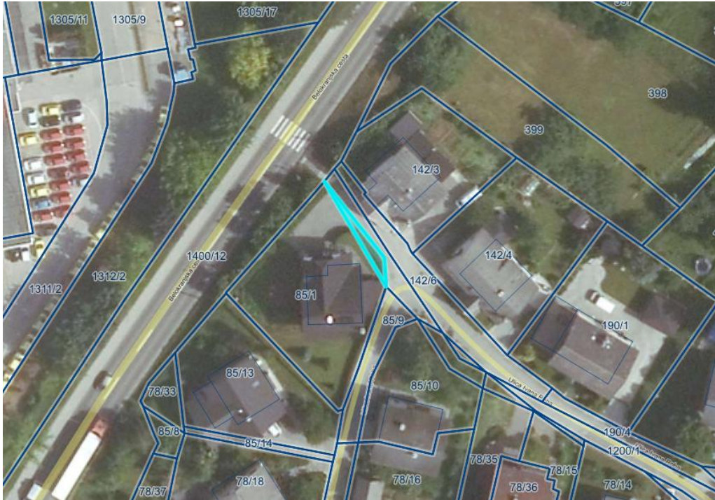
Nepremičnina parc. št. 1200/3 k.o. 1485-Gotna vas.

Nepremičnina parc. št. 1200/3 k.o. 1485-Gotna vas se nahaja na Ulici Ivana Roba. V preteklosti je nepremičnina predstavljala del javne poti, danes pa je nepremičnina deloma pozidana deloma zatravljena, na njej je vzpostavljen tudi oporni zid. Dne 11. 1. 2017 je bil opravljen terenski ogled predmetne nepremičnine. Ugotovilo se je, da je obstoječa cesta zadostne širine, saj služi le še peš in kolesarskemu prometu ter kot dostopna pot do uvoza na nepremičnino parc. št. 85/1 k.o. 1485-Gotna vas, zato ni potrebe po ohranitvi nepremičnine parc. št. 1200/3 k.o. 1485-Gotna vas, v lasti Občine.