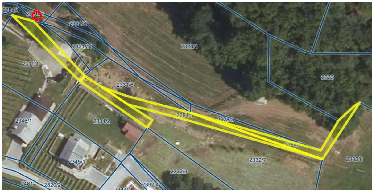
Nepremičnine parc. št. 2784/2, 2784/3, 2784/5 in 2784/6, vse k.o. 1458 – Črešnjice.

Nepremičnini parc. št. 1142/8 in parc. št. 1142/9, obe k.o. 1485-Gotna vas, ležita v naselju Šmihel, na območju Krallove ulice. V preteklosti sta nepremičnini predstavljali javno pot, danes pa le ta poteka po sosednji nepremičnini parc. št. 1038/8 k.o. Gotna vas. Predmetni nepremičnini v naravi predstavljata deloma zatravljena in deloma pozidane površine. Navedeni nepremičnini se prav tako ne uporabljata v kakšen drug namen javnega pomena, zato je ukinitvev statusa javnega dobra na omenjenih nepremičninah smiseln. Zainteresirana stranka za menjavo predmetnega zemljišča je lastnica nepremičnin ob nepremičnini parc. št. 1142/9 k.o. 1485-Gotna vas, prav tako pa stoji del nelegalno postavljenega nadstreška, ki je v njeni lasti, na predmetni nepremičnini. V zameno bi Občina pridobila del nepremičnine parc. št. 1054/5 k.o. 1485-Gotna vas. Menjavo bi predlagali tudi lastnici zemljišč ob nepremičnini parc. št. 1142/8 k.o. 1485-Gotna vas, in sicer za menjavo dela nepremičnine parc. št. 1054/6 k.o. 1485-Gotna vas.