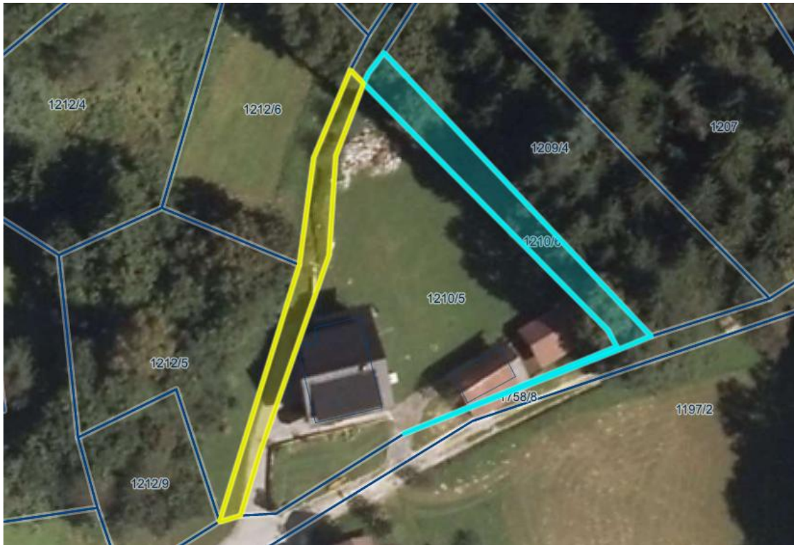
Nepremičnina parc. št. 1758/7 k.o. Stranska vas (rumeno označena) in parc. št. 1210/6 k.o. Stranska vas (modro označena).