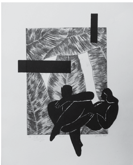
AinE je delo, ki je trenutno razstavljeno v KCJT, v Kocki.