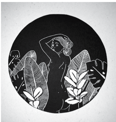
Muza2 je bila objavljena v DL, gre za pogosta motiva - rastlinje in žensko telo.

najbolj pa globoki tisk – vernis mou. Svojo strast je odkrila v alternativnih grafičnih tehnikah, ki jih raziskuje in razvija. V zadnjem obdobju največ časa posveča