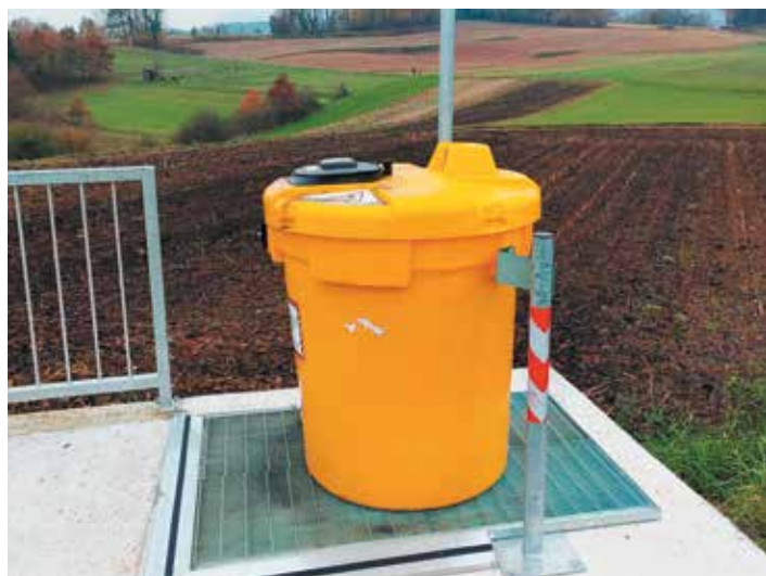
Zbiralnik za odpadna jedilna olja