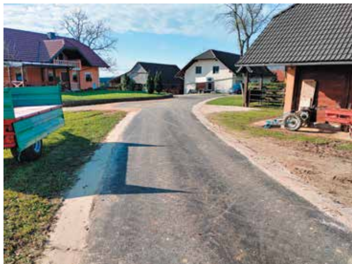
Asfaltiran odsek ceste na Daljnem vrhu