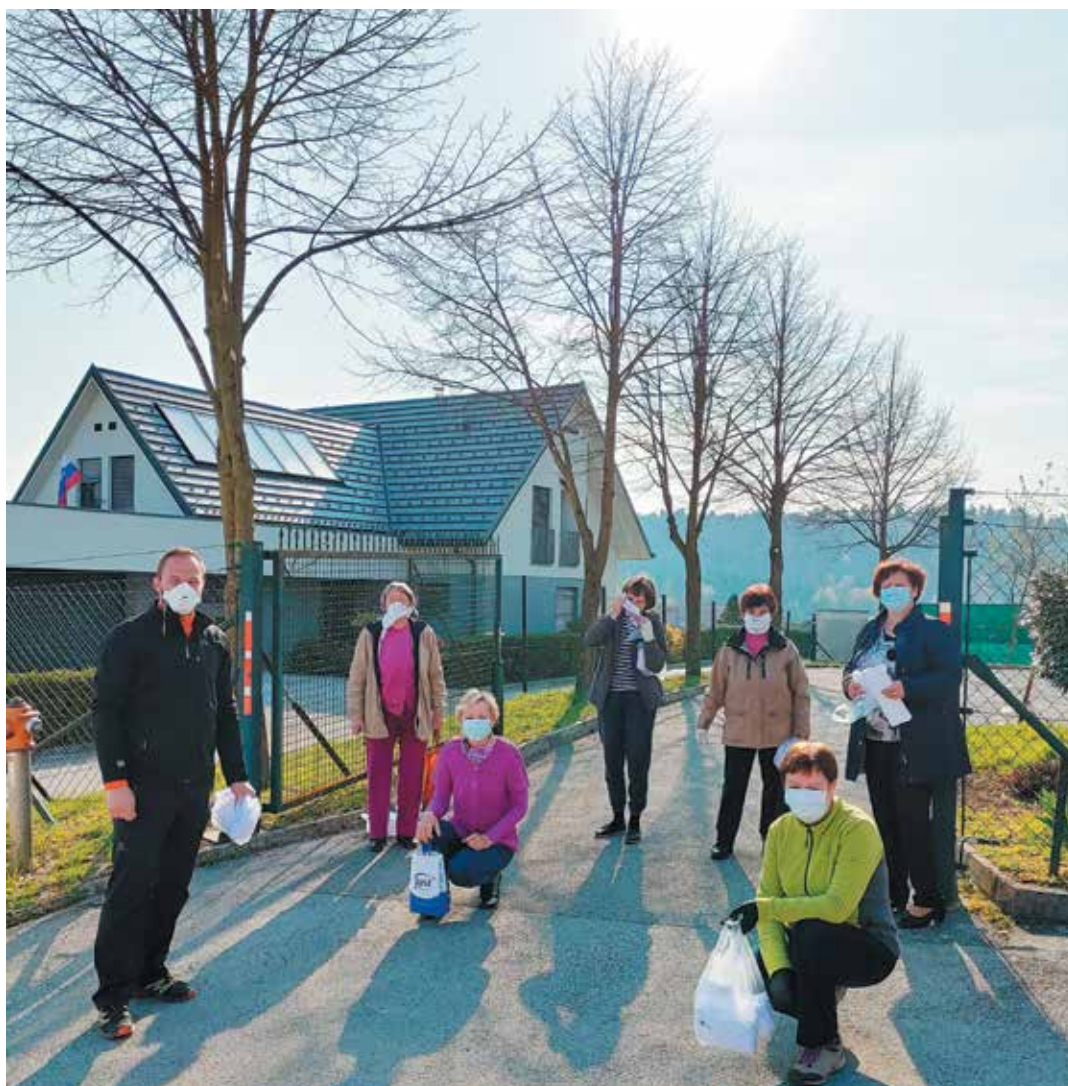
Razdelili smo zaščitne maske najranljivejšim skupinam s pomočjo naših krajanek, članic RK