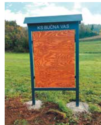
Podjetje FAR Tehnik d.o.o. je sponzoriralo tri oglasne deske