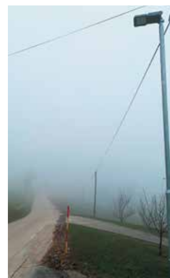
Cestna razsvetljava Daljni Vrh