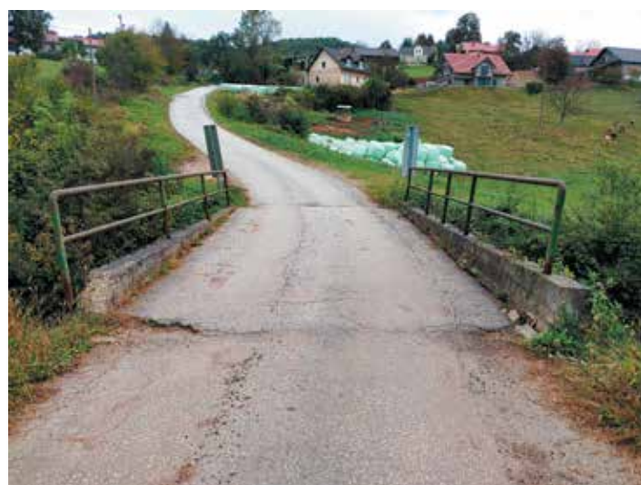
Most na Gorenjih Kamencah pred sanacijo