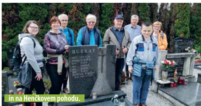
in na Henčkovem pohodu.