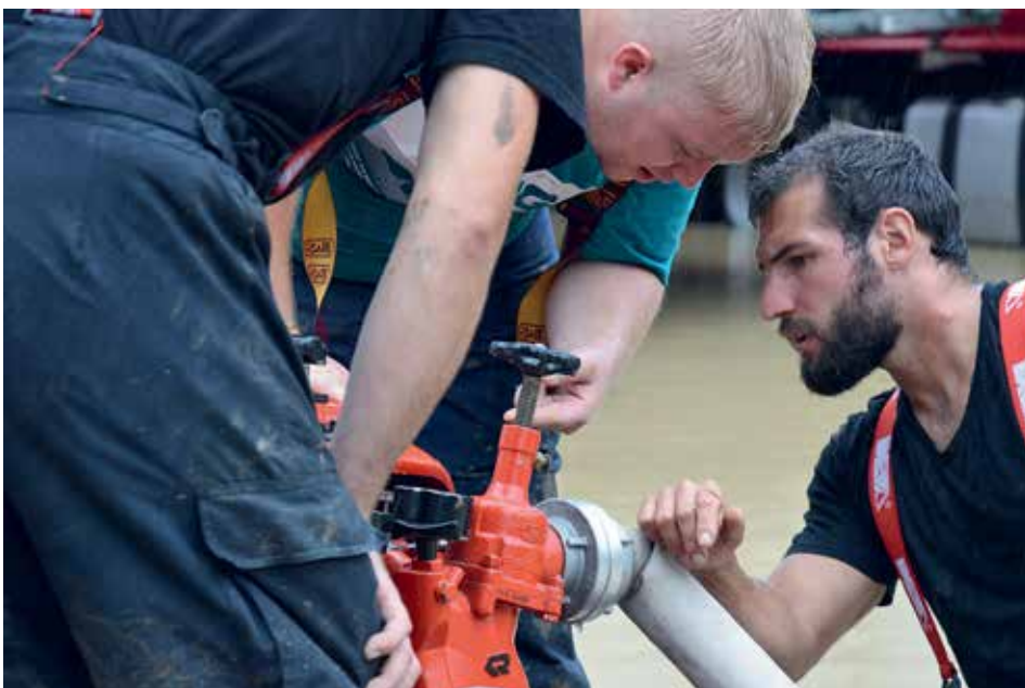
Posredovanje ob poplavah, Koroška-avgust 2023

veliko veselja. Ekipi pionirjev in mladincev sta na tekmovanjih Gasilske zveze Novo mesto slavili gladko zmago, kar je velika vzpodbuda za leto 2024, ko bodo tudi kvalifikacije za državno tekmovanje.