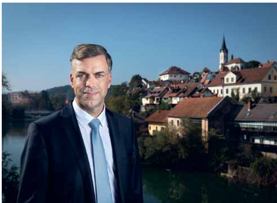
Nagovor župana ob zaključku leta 2023 - za glasilo KS Bučna vas