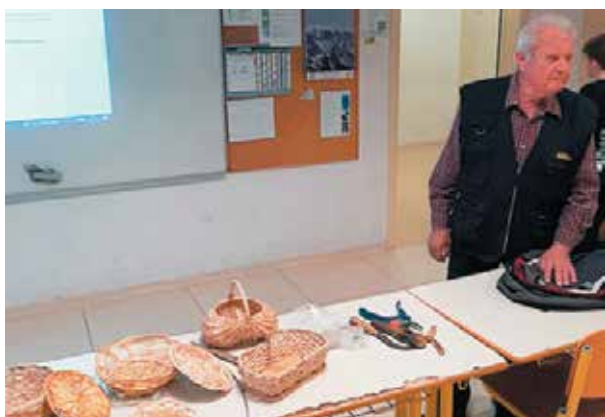
Prvo srečanje s pletarskim mojstrom