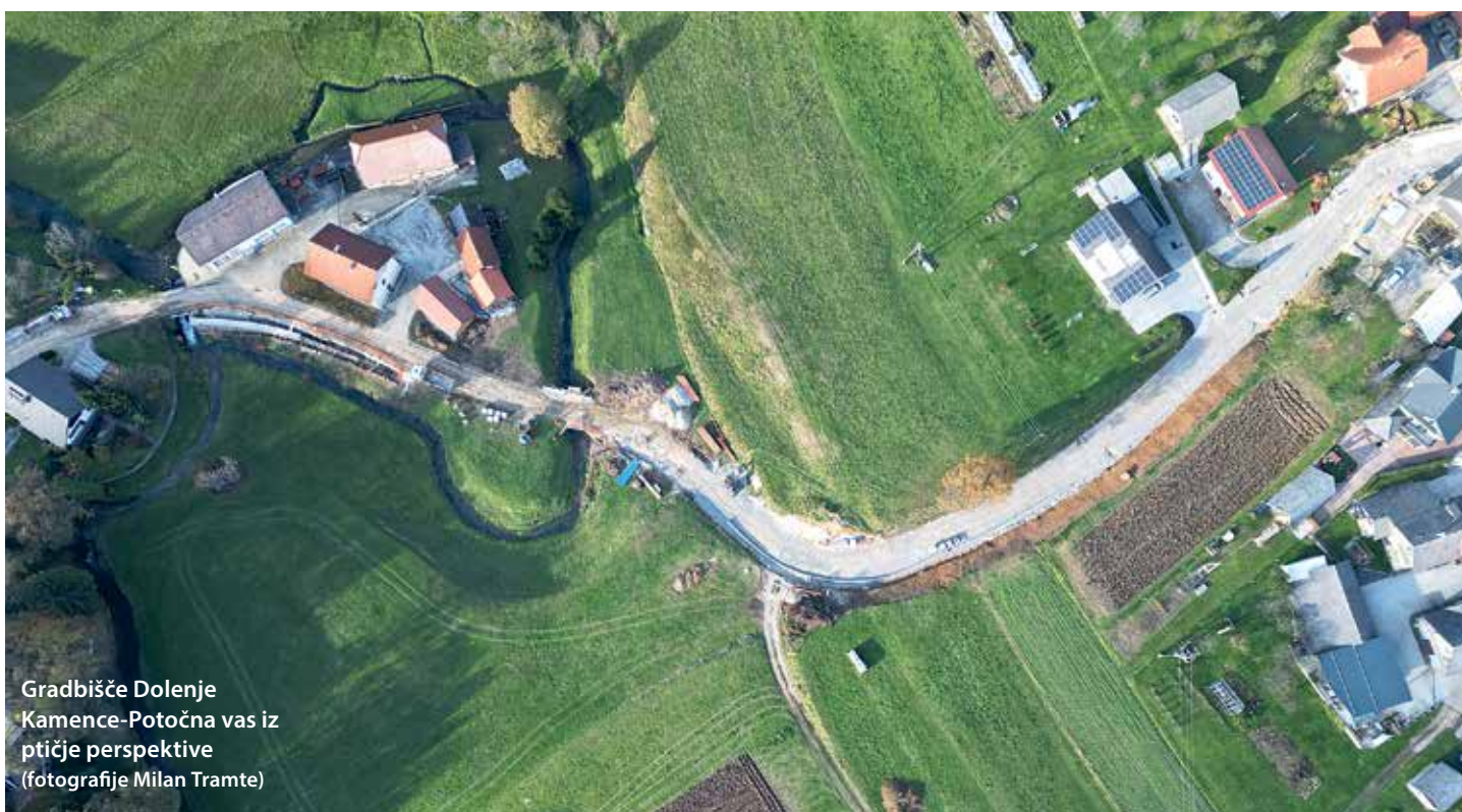
Gradbišče Dolenje Kamence-Potočna vas iz ptičje perspektive