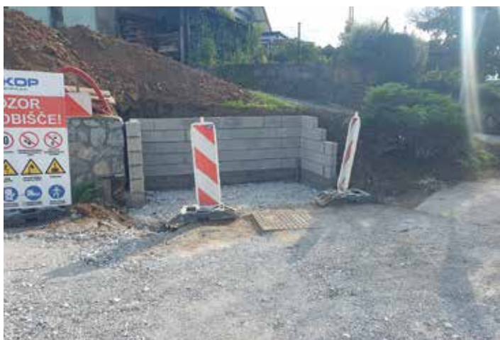
Ureditev eko otoka Dolenje Kamence