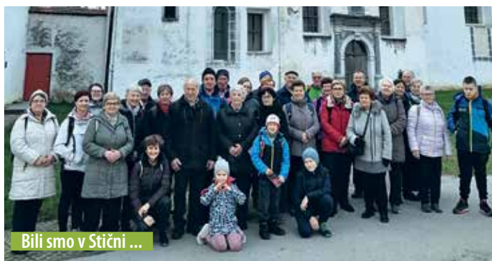
Bili smo v Stični ...