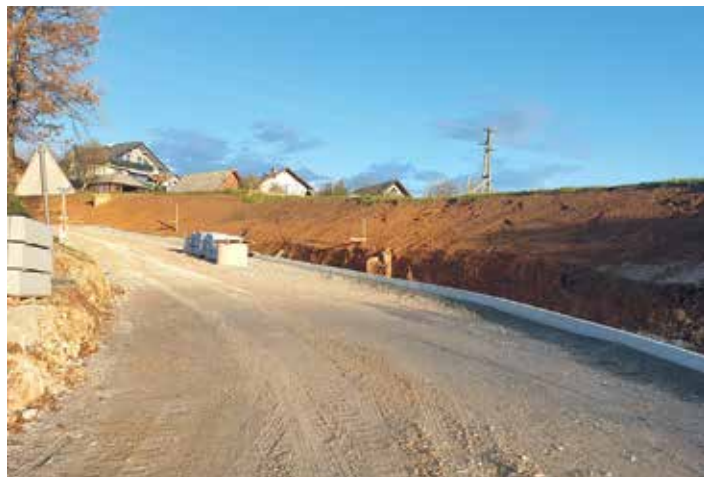
Rekonstrukcija ceste Dolenje Kamence- Potočna vas (hodnik za pešce)