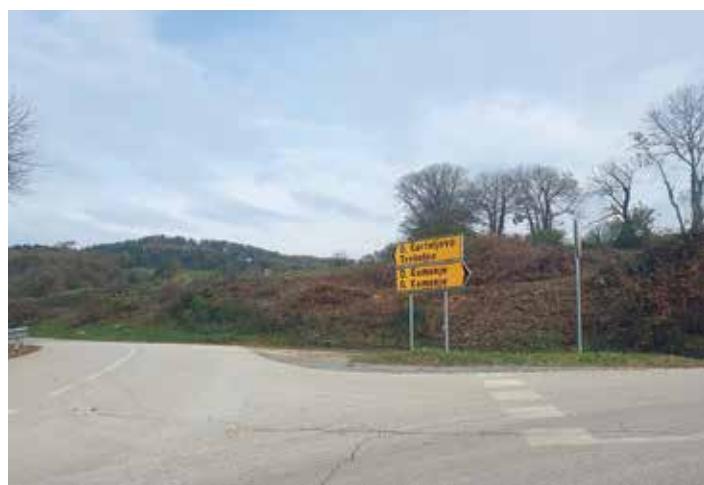
Zamenjava usmerjevalnih tabel pri Kamenju.