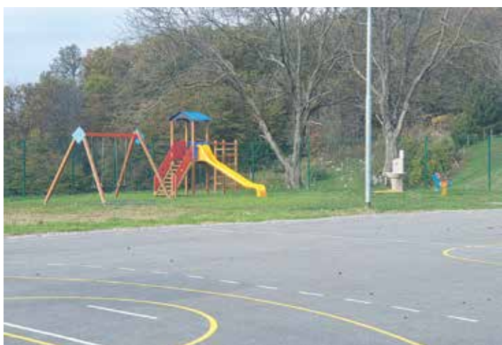
Postavitev igral in ograje igrišče Gorenje Kamenje