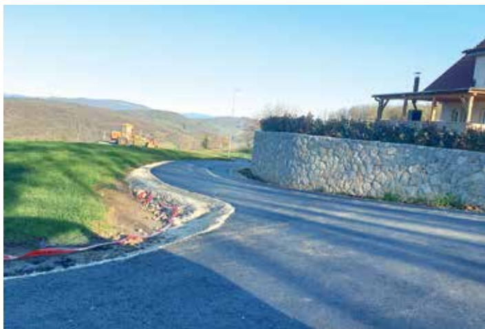
Asfaltiranje dostopne ceste igrišče Gorenje Kamenje