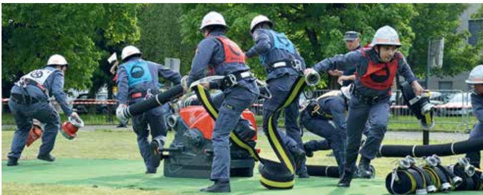
Tekmovanje za pokal Kamenc in GZ Slovenije

Če nadaljujemo s tekmovanji, so tudi člani PGD Kamence veliko delovali na tekmovanjih. Še posebno veliko dela je bilo vložena v tekmovanje mladine, saj se v društvu zavedajo, da je potrebno vlagati v mlade, ki so prihodnost in brez njih lahko društvo tudi umre. In predvsem mladi so na tekmovanjih prinesli društvu