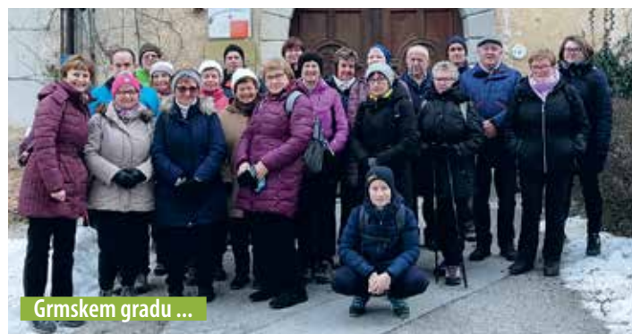
Grmskem gradu ...