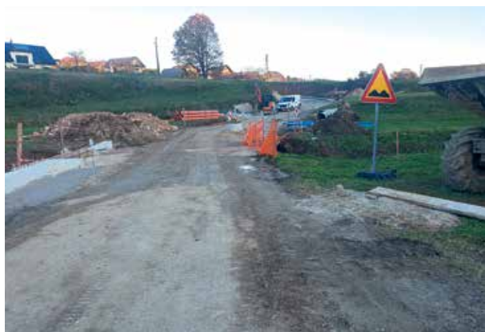
Rekonstrukcija ceste Dolenje Kamence- Potočna vas (širitev mostu)