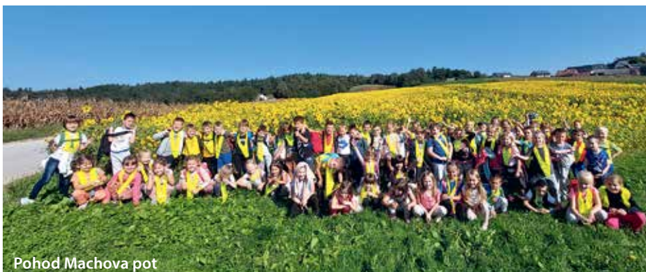
Pohod Machova pot