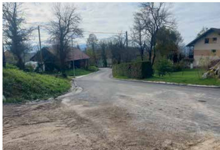
Preplastitev ceste osredji del Gorenje Kamenje