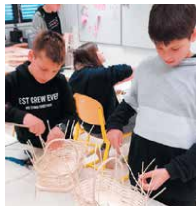
Pletenje košare z ravnim dnom