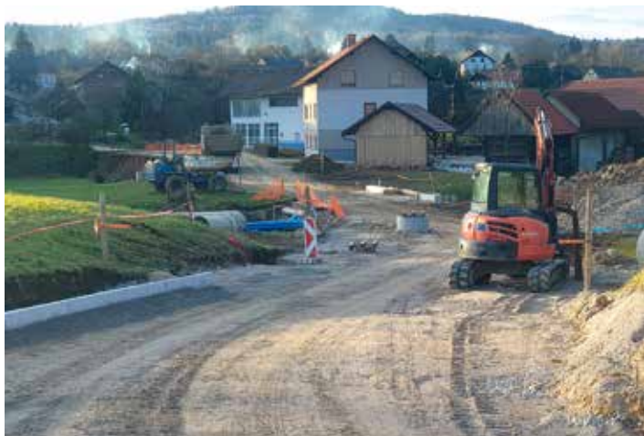
Rekonstrukcija ceste Dolenje Kamence- Potočna vas (fekalna in meteorna kanalizacija)