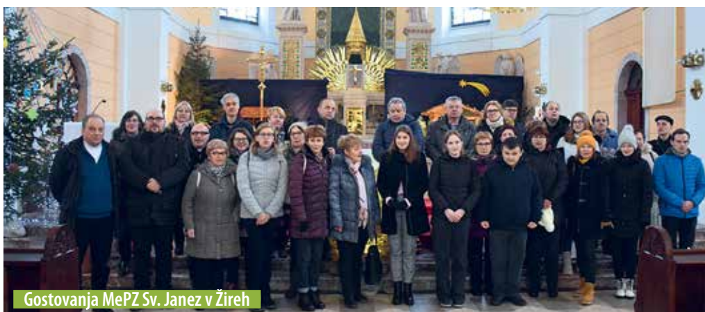
Gostovanja MePZ Sv. Janez v Žireh

Vsem krajanom in krajkankam se zahvaljujemo za aktivno udeležbo v različnih dogodkih in akcijah, bodisi na lastno pobudo, bodisi v organizaciji krajevne skupnosti ali Turistično-športnega društva Bezgavec.