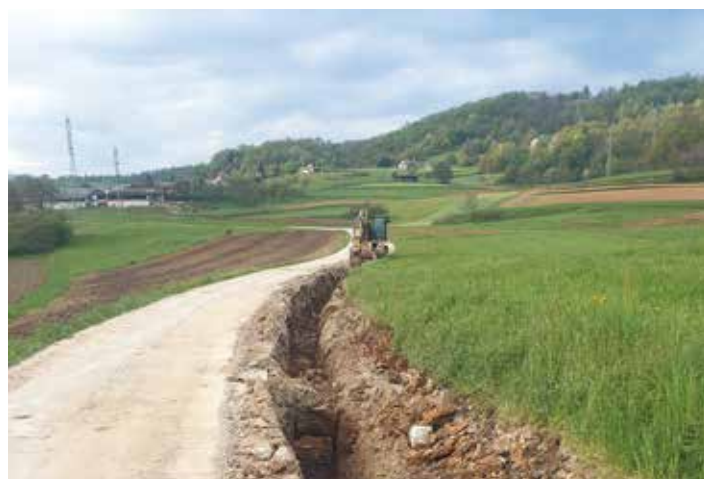
Rekonstrukcija vodovoda Dolenje Kamence-Gorenje Kamence