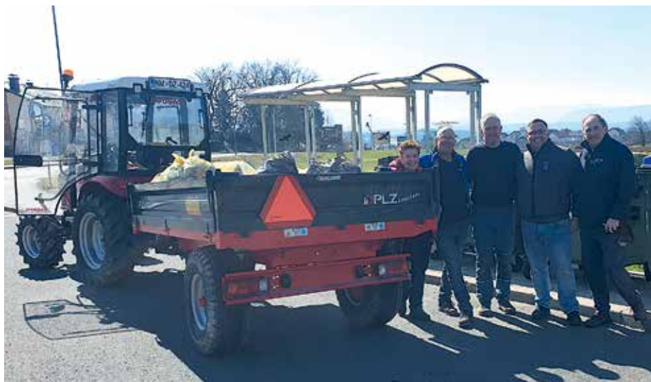
Čistilna akcija Dolenje Kamenčanov