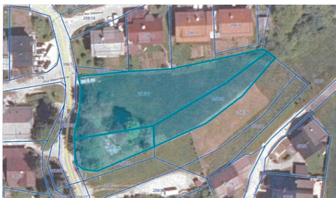
Slika 2: Lokacija zemljišč in prikaz predvidenih objektov – Ragovo