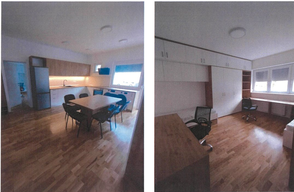
Slika 3: Bivalna enota za dijake/štolente na Smrečnikovi ulici 8