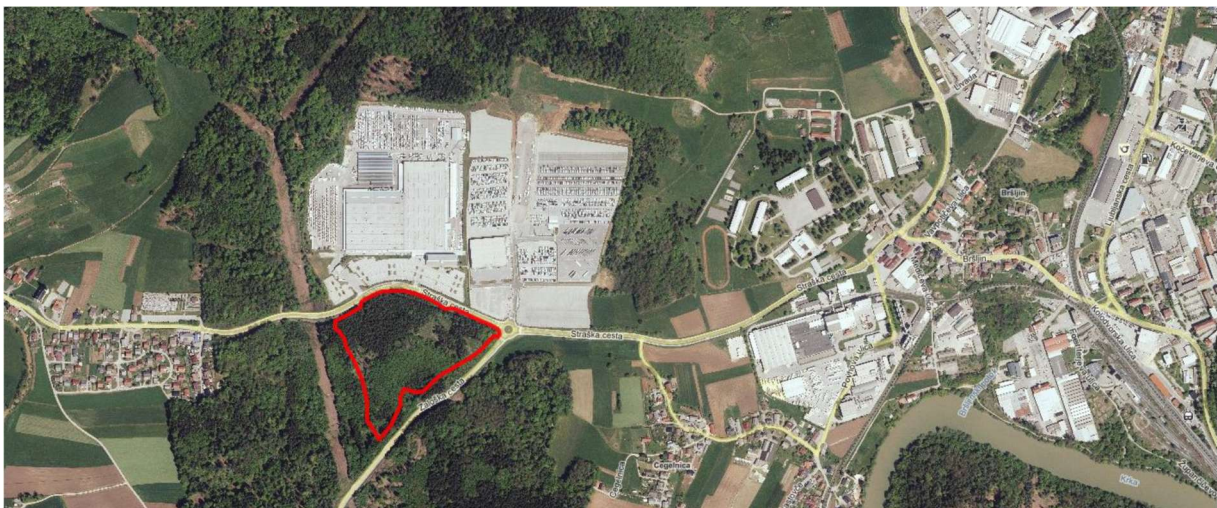
Slika 1. Okvirno območje obravnave v širšem prostoru

Zaradi gradnje novih navezav na omrežja GJI in ureditve prometnih površin so za realizacijo OPPN potrebni tudi posegi zunaj območja urejanja.