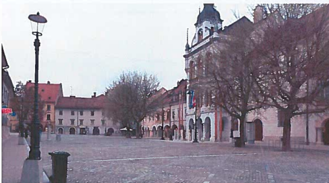
Glavni trg Novega mesta na sobotno popoldne

Zakaj, kljub temu, da je v proračunu MO Novo mesto v letu 2019 predvideno 1.417.900,00 EUR za študije o izvedljivosti projektov, projektno dokumentacijo, nadzor in investicijski inženiring niti Občani niti Občinski svet MO Novo mesto nismo bili seznanjeni s prometno študijo glede zaprtja Glavnega trga? Ali je ta študija sploh bila izvedena?