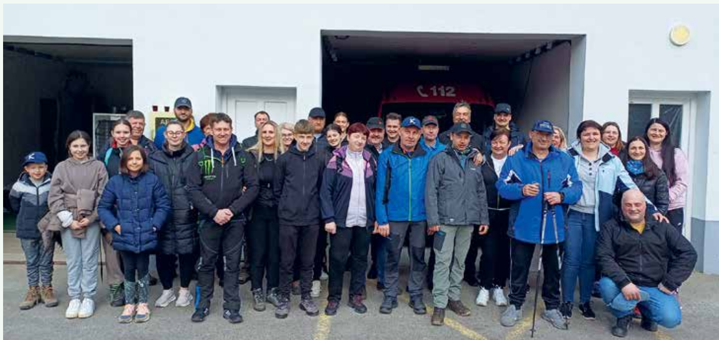
2. Tradicionalni pohod PGD Mali Podljuben

Člani PGD Mali Podljuben smo leto 2026 pričeli z občnim zborom članov, sicer pa so se že v letu 2026 enote in ostale ekipe udeležile tekmovanj na nivoju GZ Novo mesto.