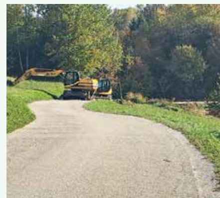
Obnova ceste na Petanah.