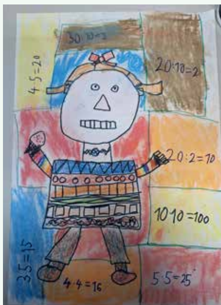
Žana Hutevec, 3. a/p