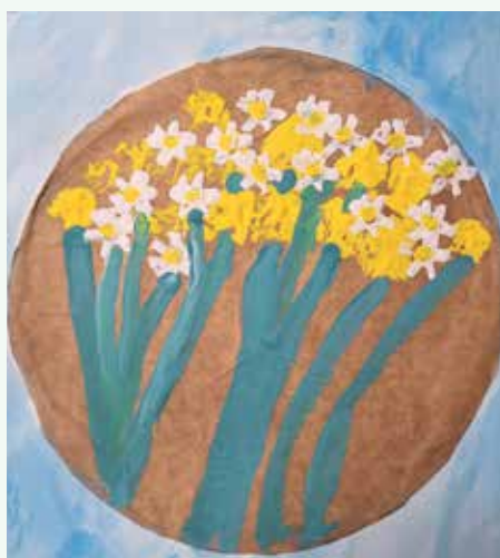
Svit Lužar, 4. a/p