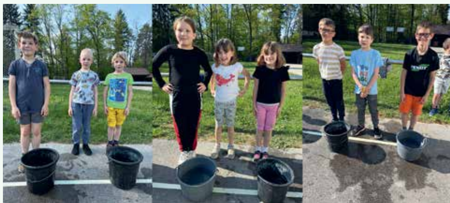
Pionirji na vajah

co. Lansko leto smo nabavili tudi nekaj nove in dodatne opreme za operativno delovanje našega društva.