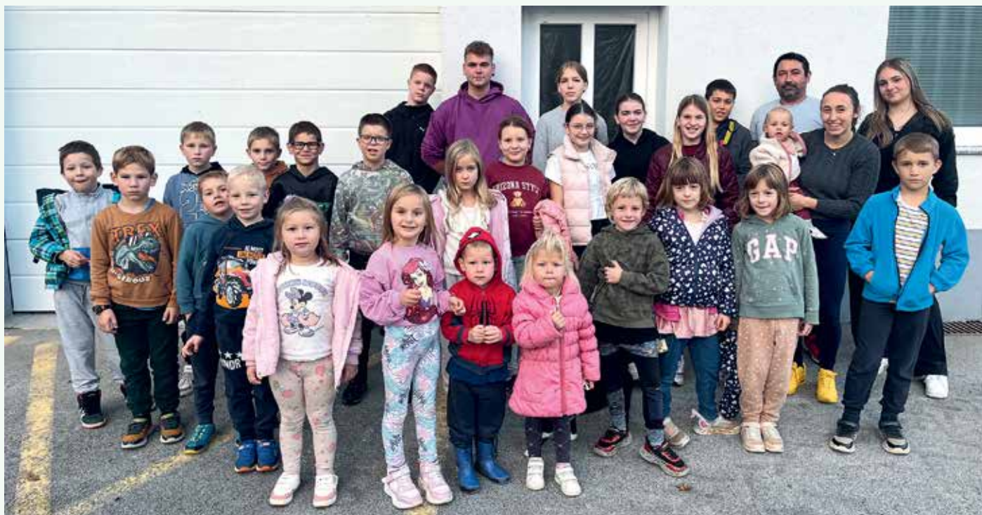
Naši najmlajši člani z mentorji