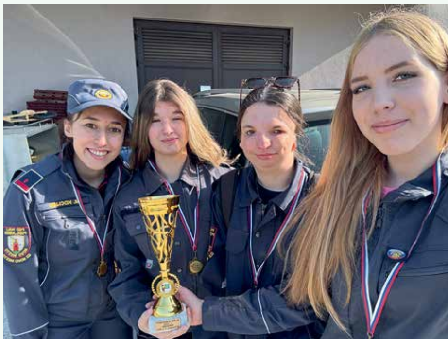
Kviz GZ Novo mesto, OŠ Šmarjeta, pripravnice 1.mesto

V letu 2025 je bilo naše društvo na vrsti za organizacijo dogodkov v sektorju, tako smo v mesecu maju v društvu organizirali sektorsko tekmovanje, na katerem so naši člani zasedli 2. mesto. V novembru smo organizirali tudi sektorsko vajo. Operativci smo sodelovali še na vaji NEURJE v organizaciji GPO Novo mesto. V letu 2025 smo bili prisotni tudi na intervenciji, ko je neurje zajelo del Novega mesta z okoli-