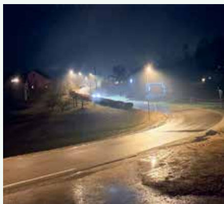
Nova razsvetljava v Birčni vasi.