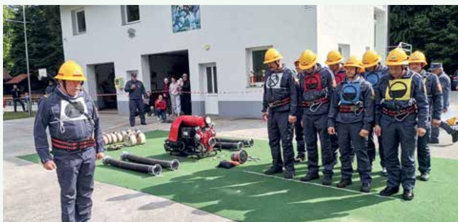
Sektorsko tekmovanje, člani PGD Mali Podljuden