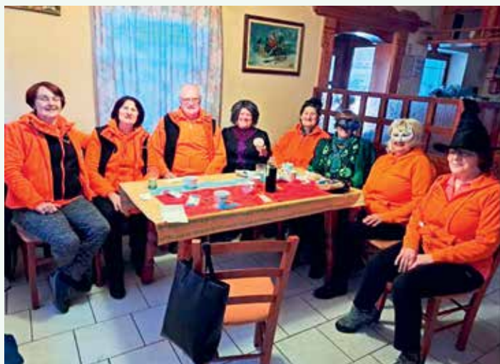
Obiskale so nas maškare.