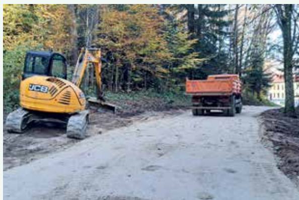
Gradnja ceste na Ušivec.