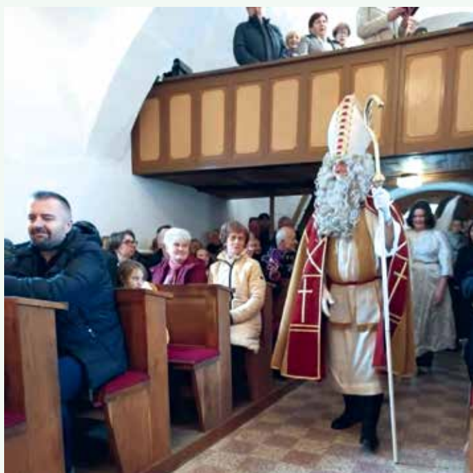
Miklavž je obiskal otroke v cerkvi v Stranski vasi. Zahvala vsem krajanom, ki prispevajo, da Miklavž vsako leto razveseli okoli 50 otrok.