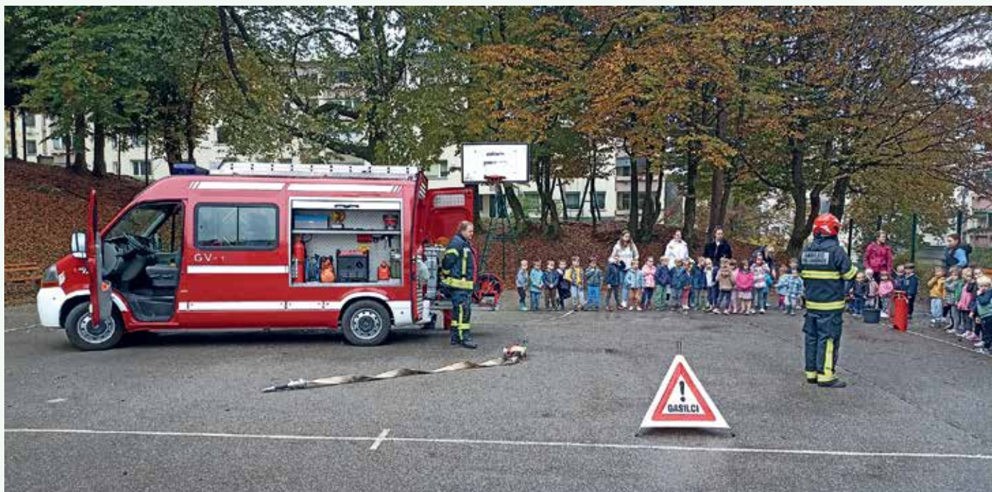
Predstavili smo se v vrtcu Ciciban.

jeti, 1. mesto v Beli Cerkvi, 1. mesto v Lokvicah, 2. mesto v Zburah, 2. mesto na Ratežu ter 1. mesto na avtorallyu.