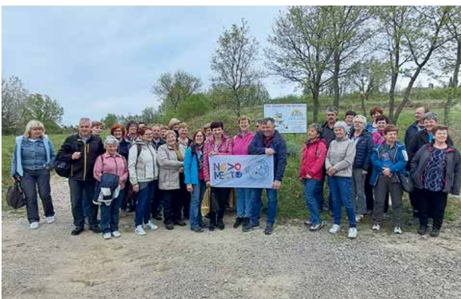
Zeliščni raj Slovenske Istre