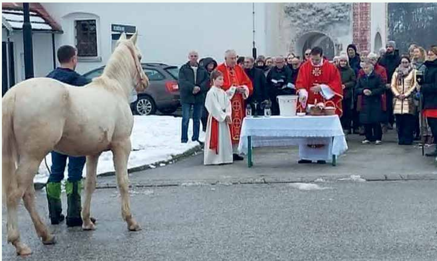
Blagoslov konj, vode in soli na Štefanovo v Stranski vasi.