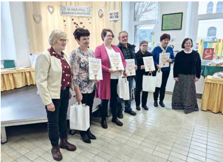
Nagrajenci z vsemi točkami

V Društvu kmečkih žena NM smo leto 2026 začeli zelo aktivno.