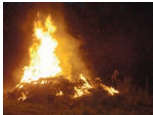
Kresovanje na Babjem hribu

Žal pa se je nekdo odločil, da bi moral letošnji kres na Ruperč vrhu zagoreti že 29. aprila. Ko smo bili obveščeni o tem, da naš kres že gori, smo se sicer zbrali na kraju dogodka, vendar pa smo lahko samo nemočno opazovali ognjene zublje, ki so počasi a vztraj-