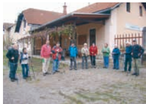
Zbiramo se na železniški postaji