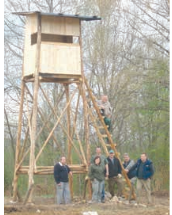
Postavljena nova lovska preža v Velikem Podljubnu (april 2012).