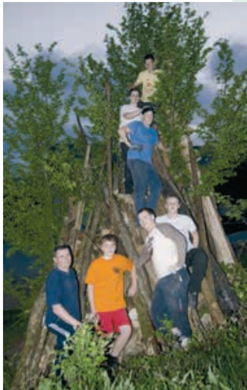
Priprava kresa na Lakovnicah

Po lanskoletnem prijetnem druženju ob kresu pri ruševinah gradu na Ruperč vrhu