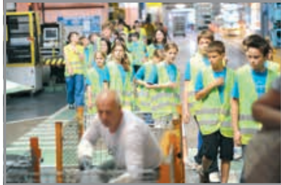
Finalisti natečaja Varnost in mobilnost za vse so si ogledali proizvodnjo Revoza.