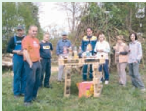
Na Ruperč vrhu smo imeli le akcijo in prigrizek