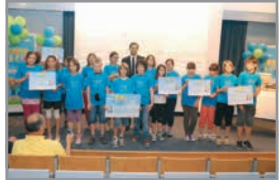
Zmagovalci prejmejo nagradno potovanje v Pariz, preostali finalisti pa donacije za dokončanje načrtanih projektov.