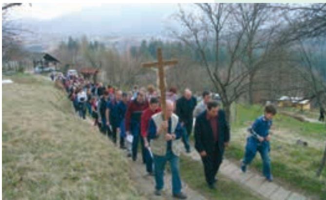
Po poti do sv. Vida

V postnem času, ki ga začnemo na pepelnično sredo, kristjani poglobljamo zavest o pomenu Jezusovega trpljenja. Opora v hoji za trpečim Gospodom, je ljudska pobožnost križevega pota. V naravnem okolju smo kristjani to pot prehodili do cerkvice sv. Vida na