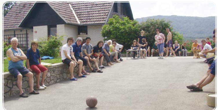
Žoga gre v gol