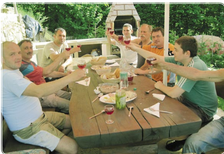
Malica je bila dokaj obilna...