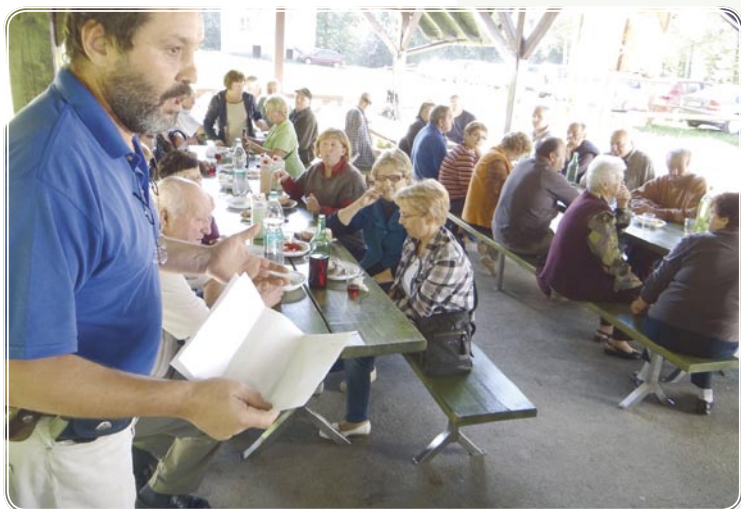
Na pikniku se okrepčamo in poveselimo.