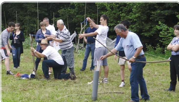
Fračarji in lokostrelci