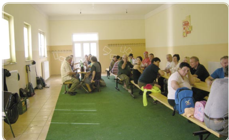
Zavetje v gasilskem domu