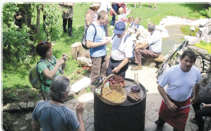
Dobrote pri Šušteršičevih