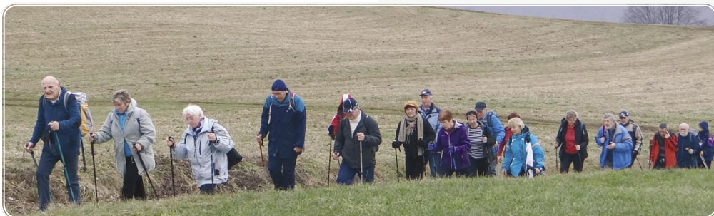
Pohodniki pa kar nadaljujejo s hojo ob četrtkih. Enkrat mesečno hodijo skupaj z upokojevci iz Novega mesta. Tako so šli skupaj na Polževo in Smuk, oboje z vlakom.