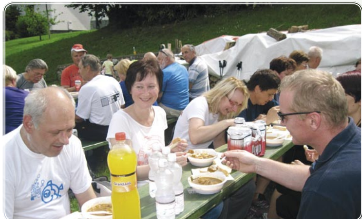
Golaž se je prilegel