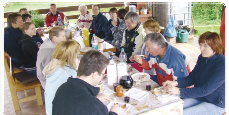
Za skupno mizo