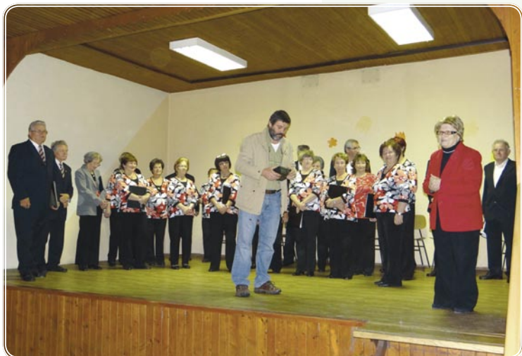
Oktober nam je zapel MPZ DU Novo mesto in zaigrali mladi nadebudni glasbeniki.