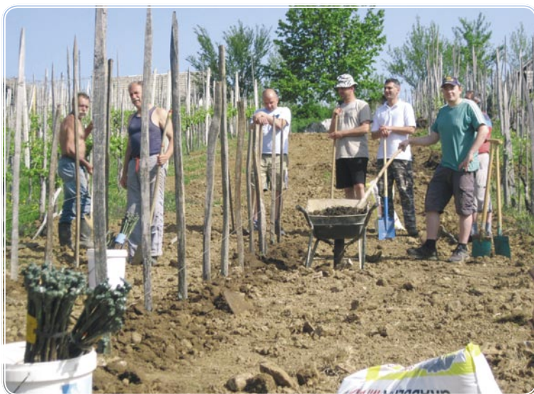
Razmišljanje, ali bi delali???