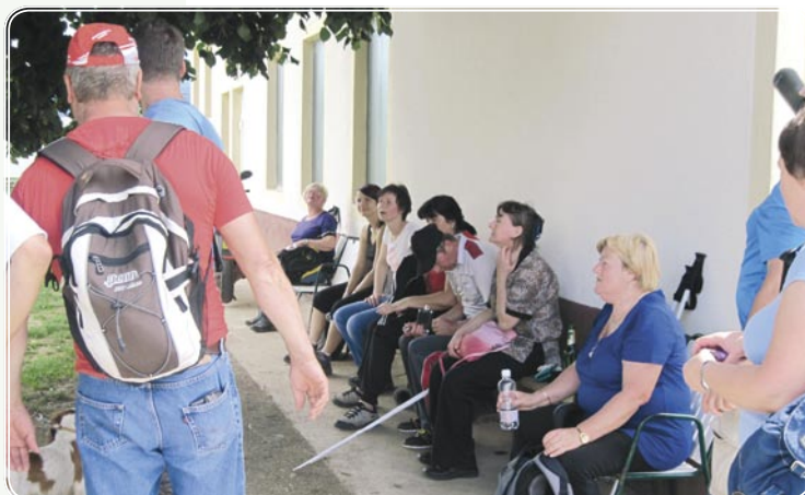
Kuhar z ljubeznijo