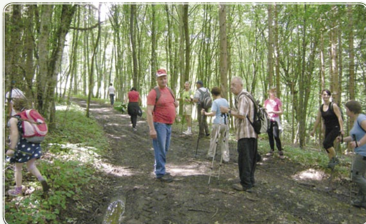
Prijetna senca v gozdu