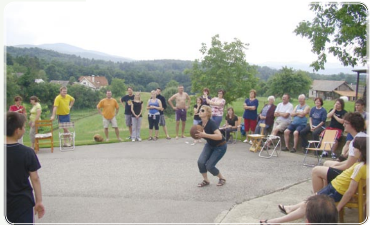
Met na koš