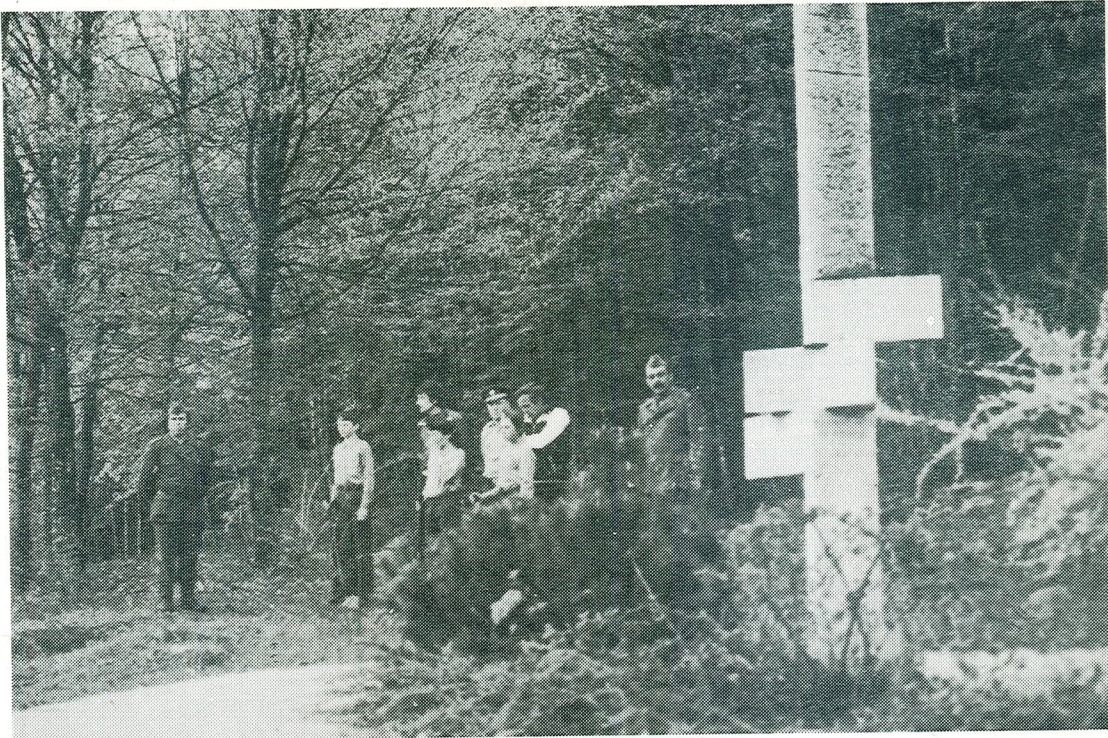
Za spomenik padlim borcem na Ruperč vrhu skrbijo ZZB Birčna vas in pionirji OŠ iz Birčne vasi. Obiskujejo pa ga tudi rezervne starešine v krajevni skupnosti.