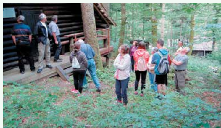
Barake partizanske bolnice Jelendol