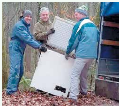
Člani ŠD Birčna vas smo tudi letos sodelovali pri čistilni akciji ...

Z veliko mero zanosa in navdušenja je bilo leta 1997 ustanovljeno Športno društvo Birčna vas. Člani so dobili nov zagon in vložili veliko ur prostovoljnega dela ter tudi finančnih sredstev, da so v naslednjih letih razširili igrišče za nogomet in celo postavili skakalnico za smučarske skoke. Ker je bilo projektov in druženja veliko, se je izkazalo, da društvo potrebuje objekt, ki bi omogočal druženje tudi v primeru sla-