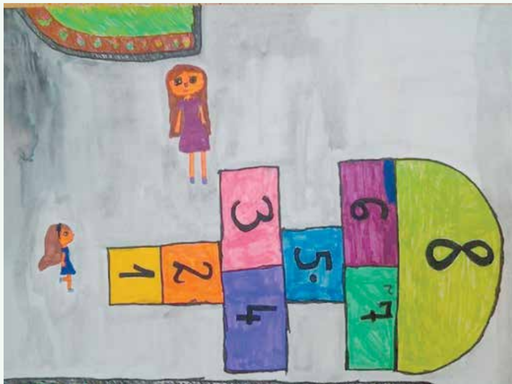
Julija Šušteršič, 5. razred

V kategoriji osnovne šole (od 1. do 4. razreda/likovni izdelek) je plaketo za 3. mesto prejela učenka Hana Bartolj (2. r., PŠ Birčna vas).