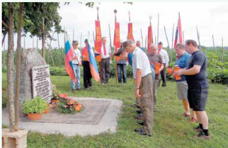
Poklonili smo se padlim borcem.

prejeli zahvale ali priznanja in celo odlikovanja za dolgoletno prizadevno aktivno članstvo.