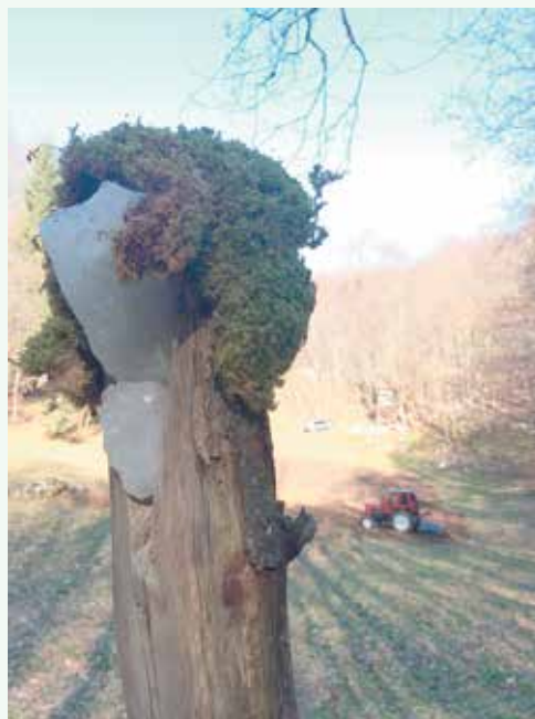
Izdelujemo solnice, ravnamo travnike, gradimo nove preže ...

Lovci se še vedno soočamo z veliko škodo na kmetijskih površinah, ki jo povzroča divjad, predvsem divji prašiči. Kljub večjemu odstrelu prašičev se obseg škode povečuje. Lovci si škodo na terenu ogledamo in se z oškodovanci pogovorimo o načinu sanacije. Kadar se dogovorimo za sanacijo travnikov (ravnanje travne ruše), v največji meri to delo opravimo sami. V nekaj letih smo za precej kmetijskih površin, ki so bile pogosto tarča divjadi, uspeli zagotoviti preko tisoč železnih stebričkov, izolatorjev, trakov, nekaj električnih pastirjev ... Vse to smo predali kmetom, da so ogradili svoje kmetijske površine. Uporaba električnega