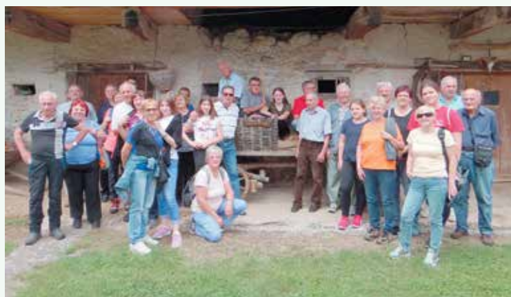
V evakuacijski bolnici Topolovec pred partizanskim rešilcem

VABLJENI NA POHOD PO POTI SPOMINOV IN TOVARIŠTVA v soboto, 6. julija 2019