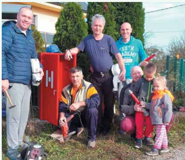
Poskrbeli smo za požarno varnost in priskrbeli ter postavili hidrantno omarico ....