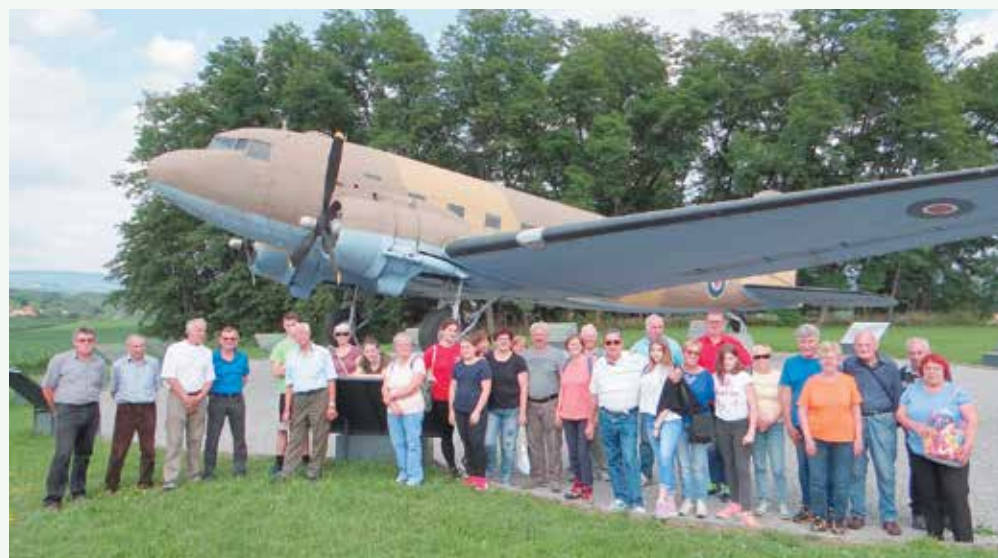
Ob zavezniškem letalu

Predzadnje soboto v juniju smo se člani krajevne organizacije ZB NOB Birčna vas odpravili na vsakoletno strokovno ekskurzijo. Tema letošnje ekskurzije je bila vojaško zdravstvo na Slovenskem s poudarkom na SVCPB v Kočevskem rogu in Beli krajini.