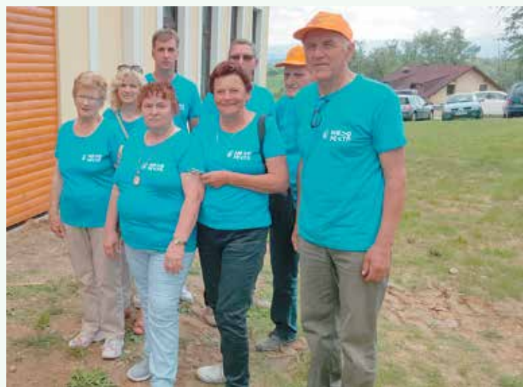
Pikaderji na športnih igrah KS MO NM lani v Prečni

Vsako sredo popoldne se dobivajo pikaderji v gasilskem domu v Stranski vasi in hitro mine ura ali dve v navijaškem vzdušju za svojo ekipo. Pikado ni naporen »šport«, primeren je za vse generacije. Pomembna je natančnost meta malega pikada v krožno