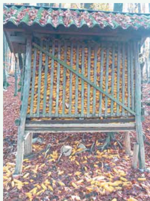
Skrbimo za zimsko krmljenje divjadi