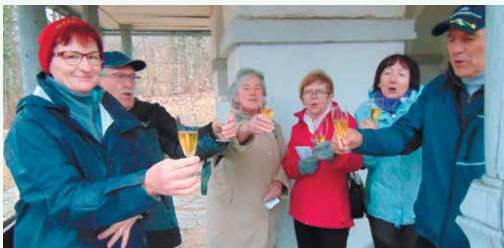
Celo voščilo za rojstni dan se dobi na Ljubnu.