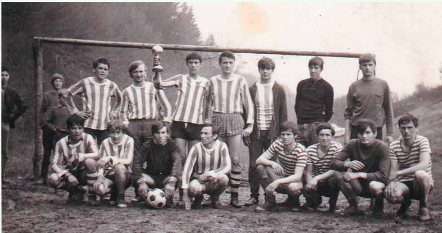
Nogometni navdušenci v Dragah s pokalom v začetku sedemdesetih let.