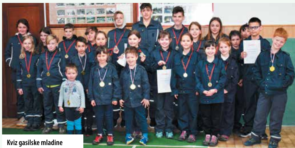
Kviz gasilske mladine

Za namen ohranitve motiviranosti in zagnanosti mladih gasilcev smo letos v aprilu organizirali tekmovanje za Kviz gasilske mladine, za kategorije pionirji in mladinci. Pri tem se še posebej zahvaljujemo za ves vloženi trud vsem našim gasilcem, otrokom ter njihovim staršem in mentorjem za izpeljavo tekmovanja in udeležbo na tekmovanju.