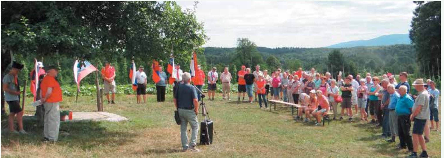
Spominska slovesnost ob 78. obletnici.

Aktivnosti smo spoštljivo do padlih borcev ter drugih žrtev okupatorjevega nasilja med NOB izvajali kljub koroni, ki nas je omejila pri delovanju večino dni v lanskem letu.