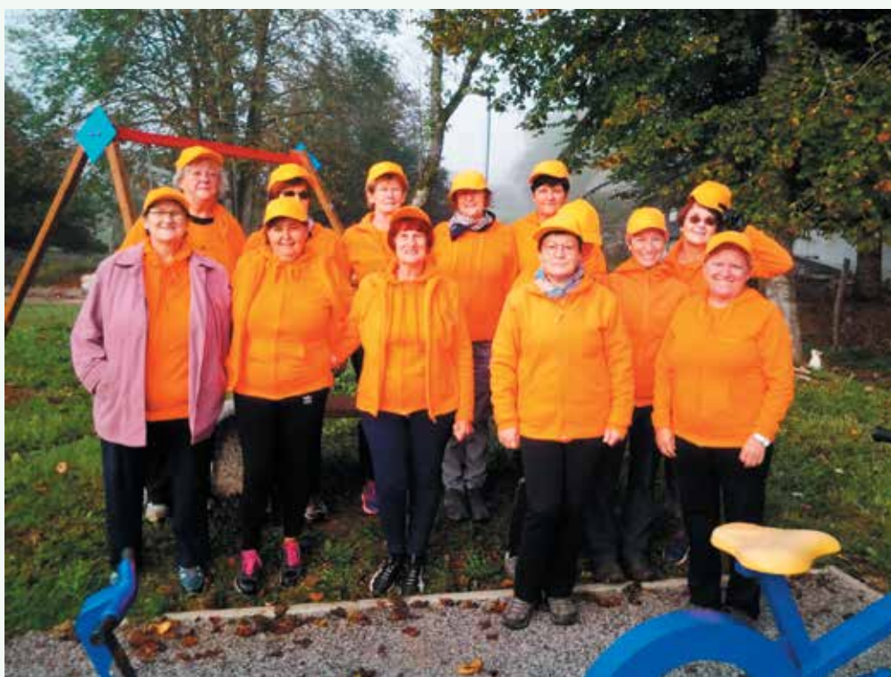
Opremljene s kapticami - sponzor KS BIRČNA VAS