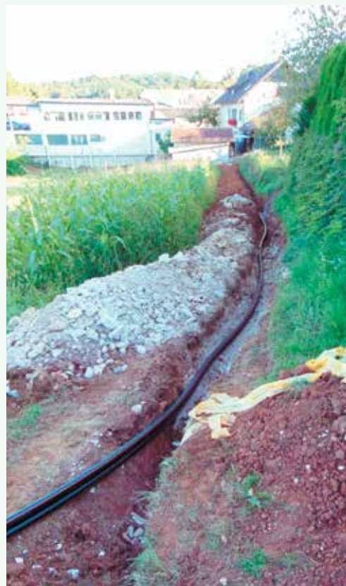
Gradnja širokopasovnega omrežja

Sodelovanje pri načrtovanju pokritosti s širokopasovnim optičnim omrežjem: Jama, Ljuben in po ostalih delih KS (pokrito bo celotno območje KS).