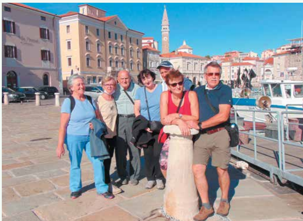
Vabljiva obala od Izole do Pirana, sprehod na grad po razgled in slovo v luki.