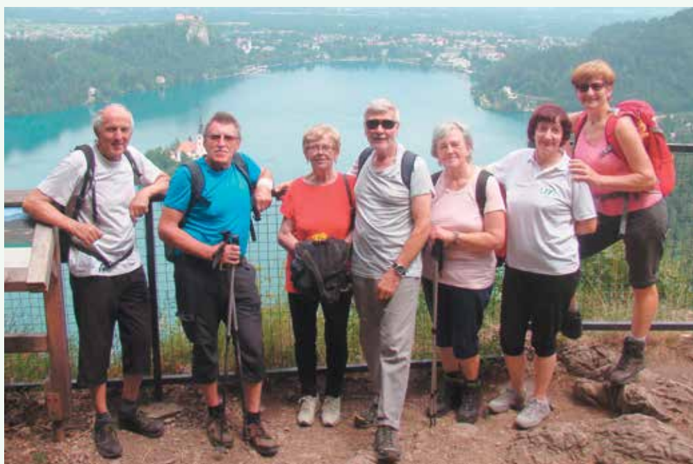
Sprehodili smo se okrog jezera, za razgled na Bled smo se povzpeli na bližnji grič, na otok nas je peljala pletna, zaključili smo z blejsko kremno rezino.