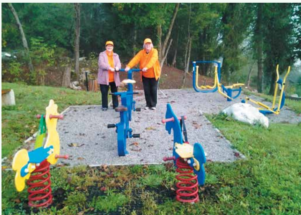
1. oktober 2021 - najbolj vztrajni udeleženci Šole zdravja

Avtorice: Marjana Golob, Vida Šter, Ana Ponikvar (po melodiji »NA ROBLEK« )