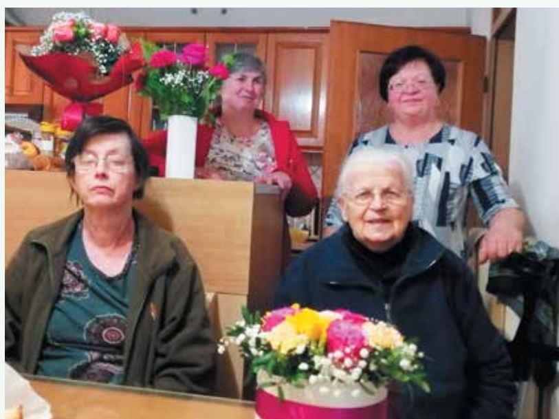
Bučarjeva v krogu družine

Želimo ji, da bi jo energija in vitalnost spremljala še veliko časa.