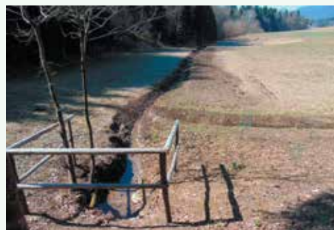
Izvir potoka v Rupci