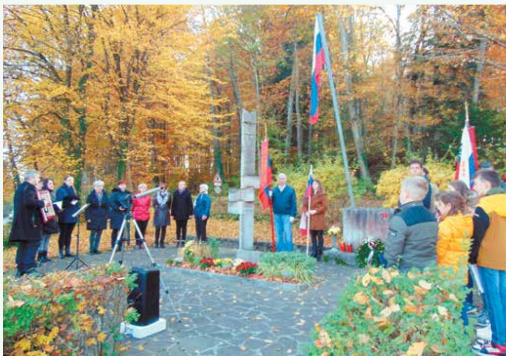
Žalna slovesnost ob dnevu spomina na mrtve.