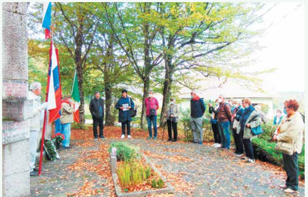
Obisk iz Italije.