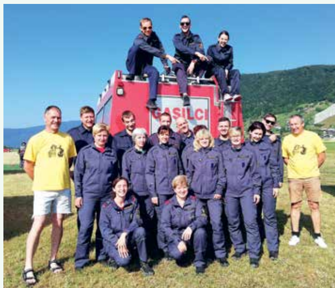
Avtorally 2018 – člani A in članice B

Zavedamo se pomembnosti druženja med mladimi gasilci in sodelovanja v različnih gasilsko-športnih disciplinah, zato najmlajše člane spodbujamo, da se udeležujejo tako kviza gasilske mladine in tekmovanja v orientaciji kot tudi pionirskega in mladinskega tekmovanja, kjer se pomerijo v različnih disciplinah. Ravno na začetku tega leta so na tekmovanju v Kvizu gasilske mladine v organizaciji GZ Novo mesto enega boljših uspehov dosegli pionirji in mladinci, ki so zasedli odlično 3. mesto in se uvrstili na regijsko tekmovanje.