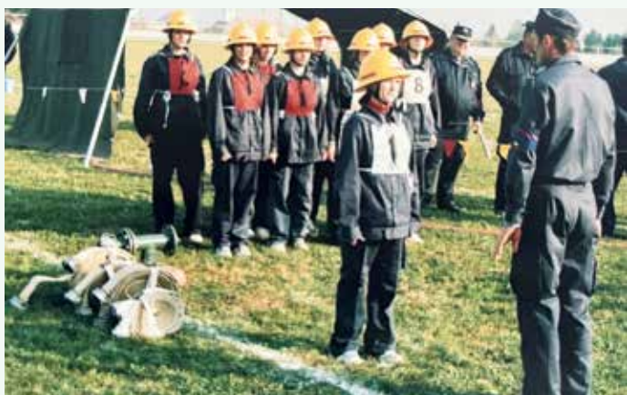
Mladinsko tekmovanje 2000