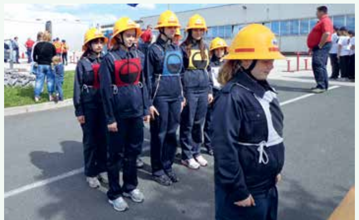
Regijsko tekmovanje 2013 – mladinke