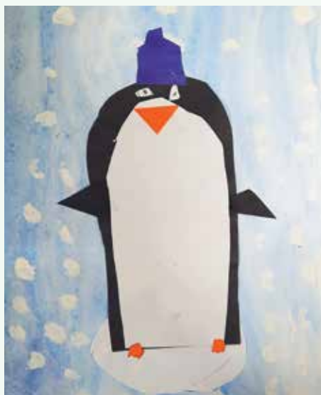
Žana Hutevec, 2. r.