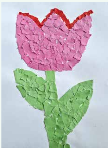
Lara Šušteršič 3. a