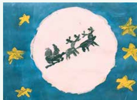
Nik Podržaj, 5. r.