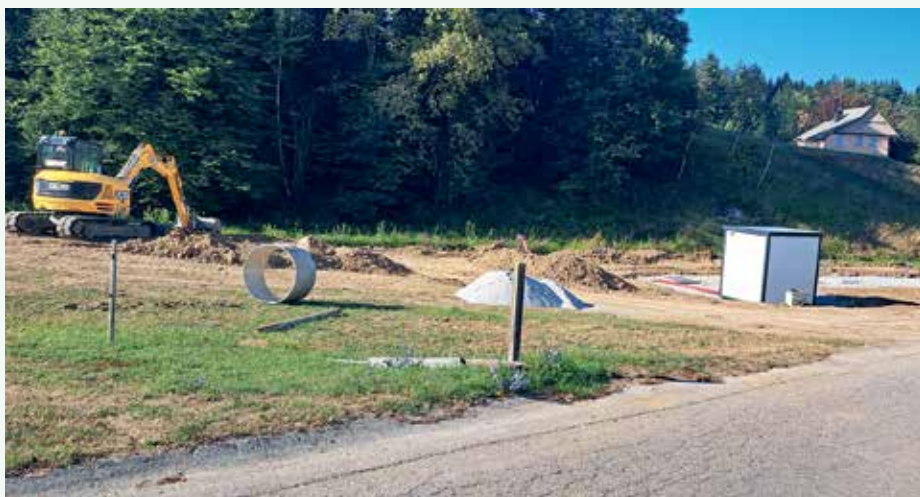
Gradnja čistilne naprave

Prišla je pomlad, z njo čas izida našega Šuma sekvoj in čas za pregled opravljenega dela v naši skupnosti. Letos konec maja praznujemo 60-letnico od ustanovitve Krajevne skupnosti Birčna vas.