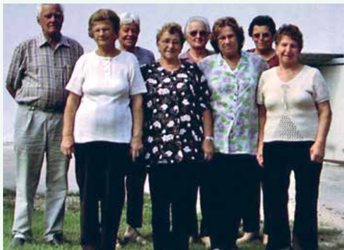
Ustanovni člani leta 2005