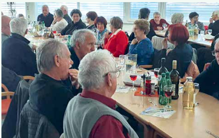
Srečanje starejših v Domu starejših občanov Novo mesto.

bili naše starejše na srečanje, ki smo ga organizirali v Domu starejših občanov Novo mesto. Srečanje smo obogatili s kulturnim programom, ki je vedno prisrčen, saj nastopajo otroci Podružnične šole Birčna vas. Za trud in pripravljenost se učiteljicam in otrokom zahvalujemo. V naši krajevni skupnosti je 169 krajanov starejših od 72 let, srečanja se jih je udeležilo 54.