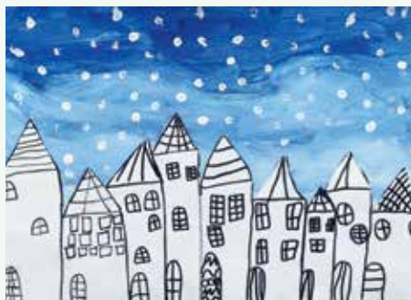
Kataleja Hrovat, 1. a