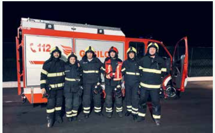
Sektorska vaja 2023