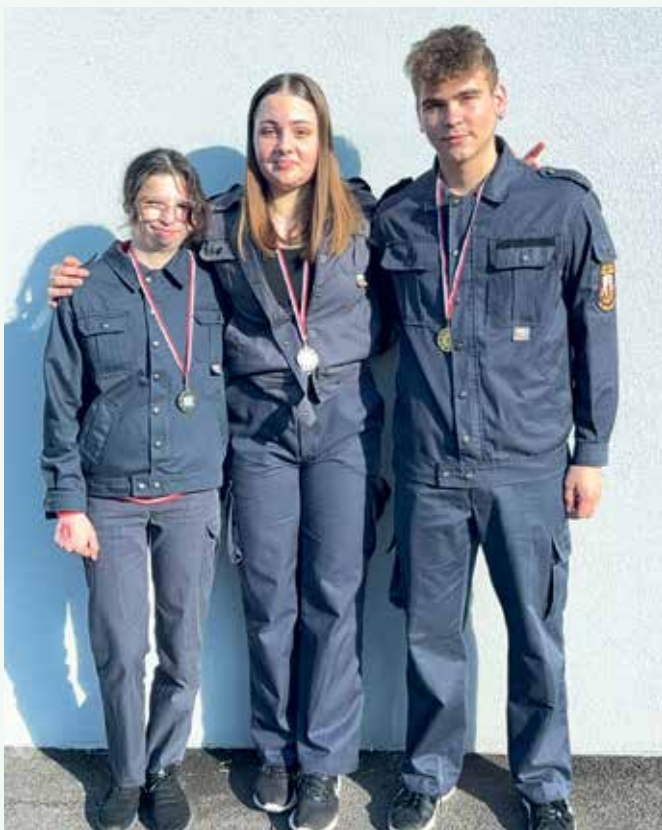
Mladinci na orientaciji

gasilske mladine udeležile tri ekipe mladincev in pionirjev. Mladinci so dosegli 1. in 4. mesto, pionirji pa 3. mesto. S temi odličnimi rezultati sta se dve ekipi uvrstili na regijsko tekmovanje v