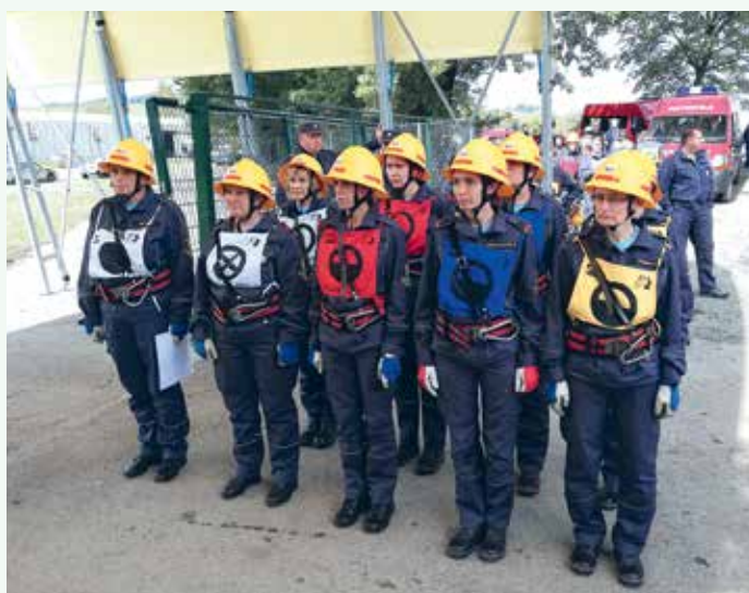
Državno tekmovanje 2018 – članice B