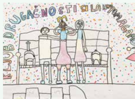
Pika Gašper, 5. r.