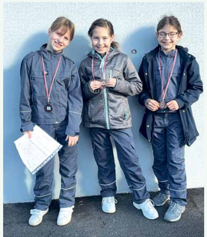
Pionirke na orientaciji