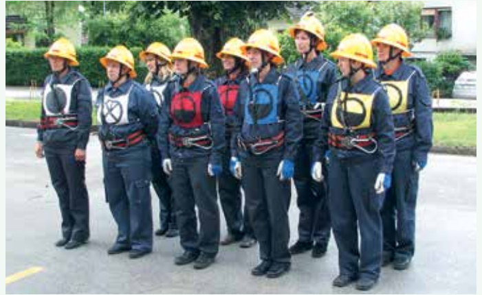
Avtorally 2009 – članice B

V naslednjih dveh letih so marljivi člani društva uredili nadstrešek pri sanitarijah ter pripravili dokumentacijo in priklop h kanalizacijskemu omrežju. Urejali smo tudi okolico gasilskega doma in namestili igrala, ki jih je financirala KS Birčna vas. Leta 2018 smo po nekajmesečnih prizadevanjih dočakali pomembno pridobitev v krajevni skupnosti – napravo AED (avtomatski elektronski defibrilator), ki je nameščen ob garažnih vratih gasilskega doma. Sodelovali smo tudi v eni najzahtevnejših intervencij, gašenju požara v Ekosistemih v Zalogu, kjer smo utrpeli kar veliko materialno škodo, ter pri sanaciji objektov po katastrofalni toči v Črnomlju in okolici. Članice B so žele uspeh