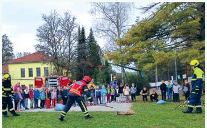
Podružnica Birčna vas 2023

za uspehom in se v tem letu spet uvrstile na državno tekmovanje, ki je potekalo septembra v Gornji Radgoni. Leto kasneje smo se lotili sanacije odra in namestili ograjo ob stopnicah, ki vodijo na oder. V letih 2020 in 2021 je večino naših aktivnosti zaustavila epidemija korone, leta 2022 pa smo spet aktivno poprijeli za delo in se intenzivno začeli pripravljati na tekmovanja. V gasilskem vozilu je bilo potrebno zamenjati visokotlačno črpalko, Istočasno je bila predelana nadgradnja vozila, tako da so bili nameščeni novi kosi opreme in orodja, na svetlobnem stolpu smo obstoječe reflektorje zamenjali z LED reflektorji. Sodelovali smo tudi pri gašenju katastrofalnega požara na Krasu. Zadnji dve leti smo namenili predvsem sanaciji in izboljšavi prostorov v gasilskem domu, nameščeni so bili tudi grelni paneli v garaži in spodnjem prostoru gasilskega doma. Na področju alarmiranja članov smo