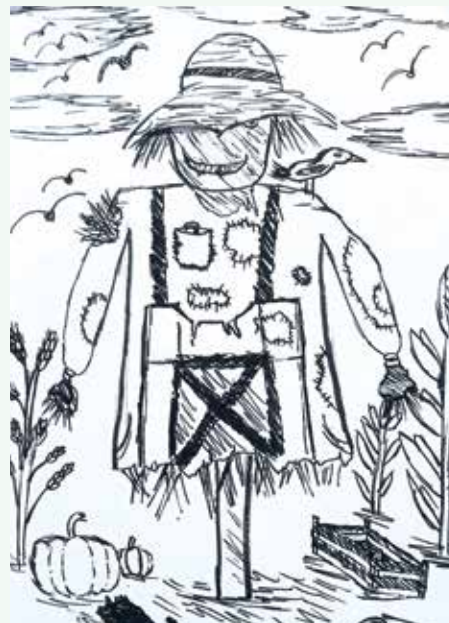
Nejc Bukovec, 5. r.