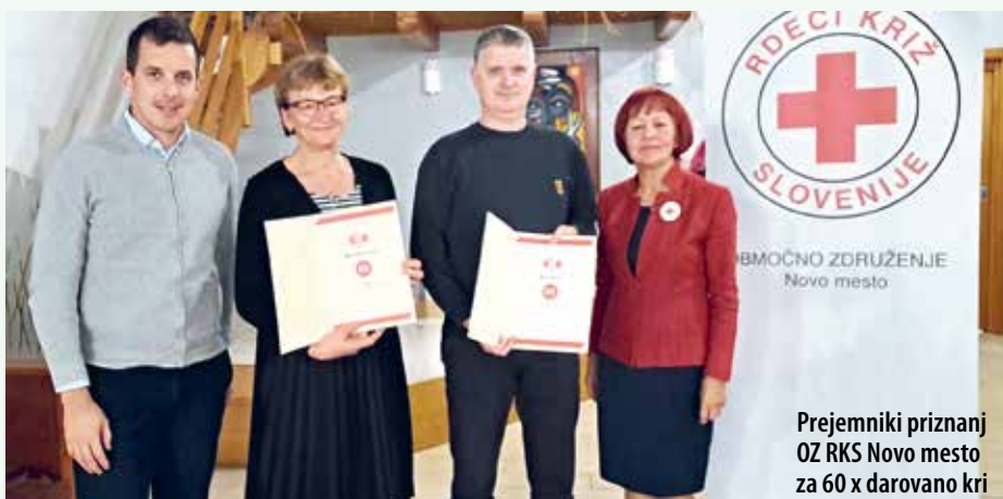
Prejemniki priznanj OZ RKS Novo mesto za 60 x darovano kri