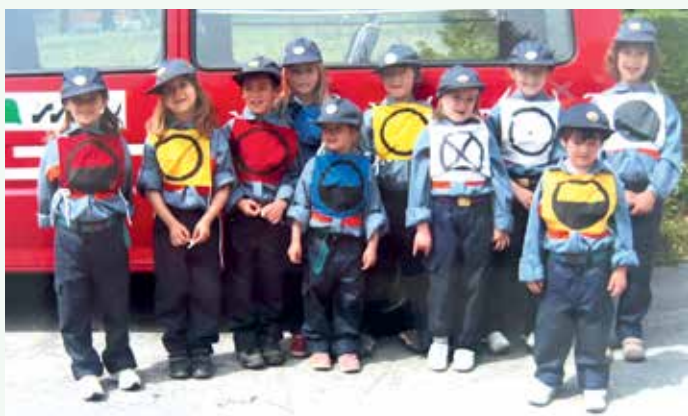
Pionirsko tekmovanje 2006