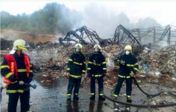
Intervencija – Zalag 2017