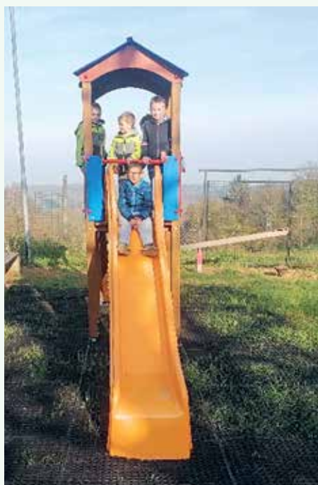
Igrala v Podljubnu

Projekt javne razsvetljave v Birčni vasi ob državni cesti. Že več let si prizadevamo za varno hojo in vožnjo skozi naselje po cesti, ki je ena od povezav z Belo krajino in je obremenjena še z vožnjo tovornjakov z lesom na deponijo pri žel. postaji. Del razsvetljave je bil zgrajen z rekonstrukcijo ceste od podvoza pod