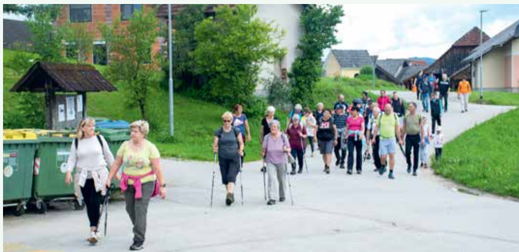
Prispeli smo na cilj

Letošnja pomlad je precej deževna, a mi smo imeli srečo, da smo 17. pohod po KS Birčna vas izvedli v lepem vremenu.