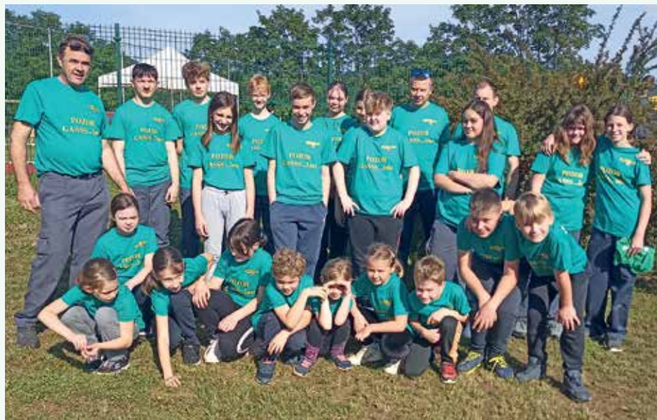
PGD Lakovnice, pionirji-mladinci