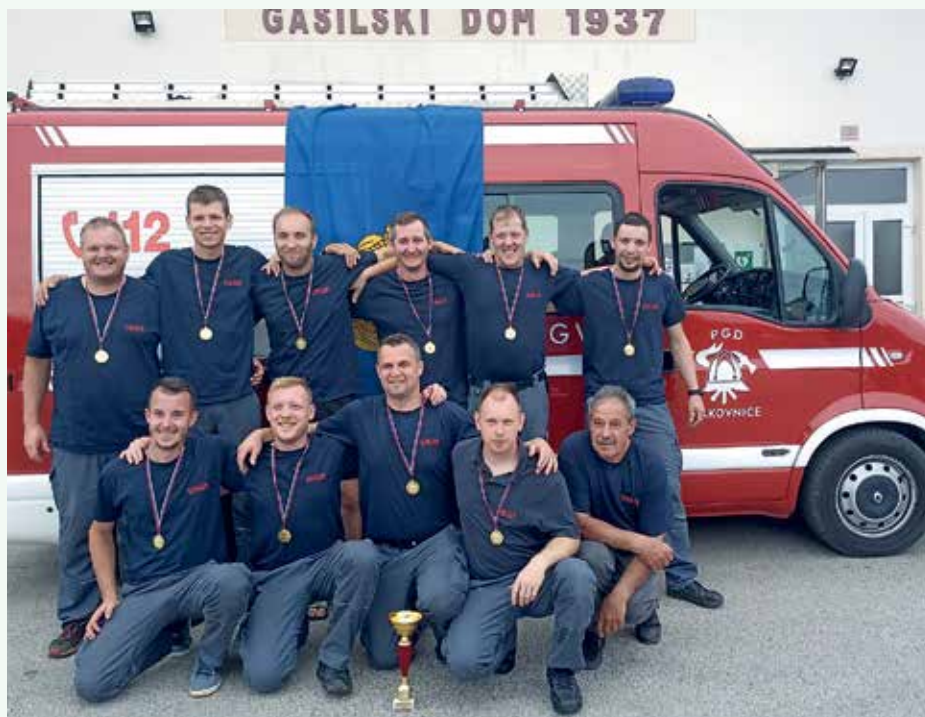
PGD Lakovnice, člani A

V preteklem letu smo bili aktivni tudi na