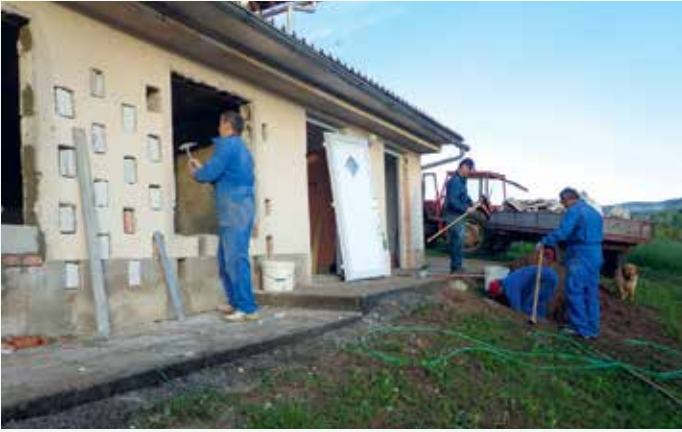
Delovna akcija 2013