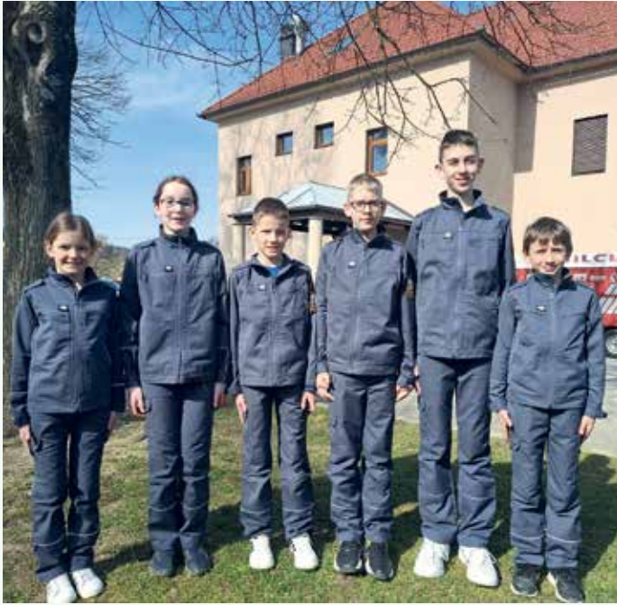
Kviz – pionirji in mladinci 2025

Sedem desetletij je dolga doba – toliko let požrtvovalnosti, predanosti in neomajne pripravljenosti pomagati sočloveku v stiski, toliko generacij gasilcev, ki so ne glede na uro, vreme ali razmere, stopili skupaj, ko je bilo to najbolj potrebno. Ob tej priložnosti se