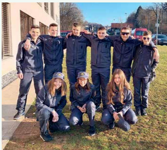
Kviz – mladinci 2023