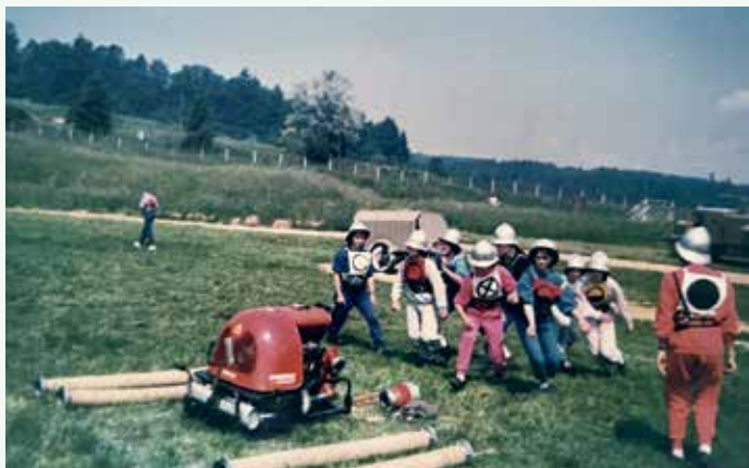
Mladinsko tekmovanje 1988