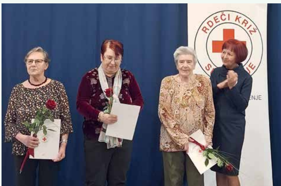
Prejemnice priznanj, zaključek prostovoljstva