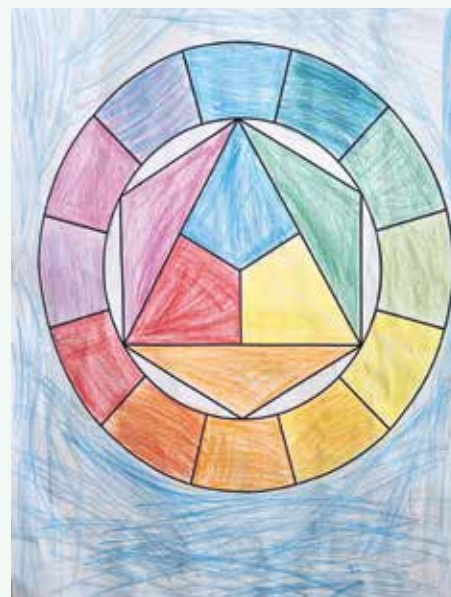
Gaber Pugelj, 3. a