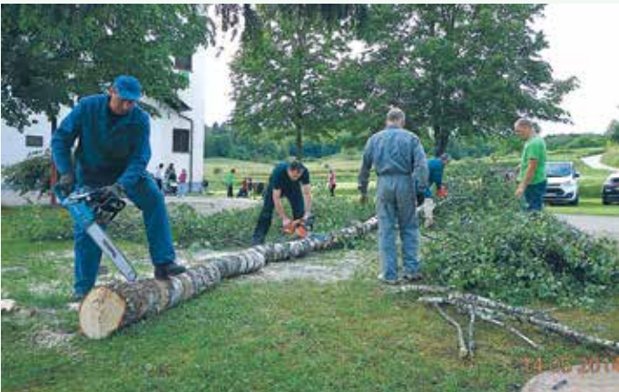
Delovna akcija 2015