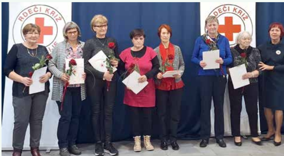
Prejemnice priznanj OZ RKS Novo mesto

Zadnjih nekaj let so nam razmere, v katerih smo se znašli, oteževale druženje. V lanskem letu pa smo spet lahko pova-