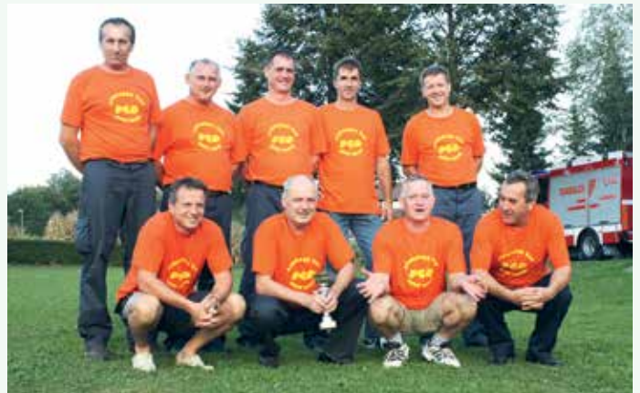
Regijsko tekmovanje 2011 – člani B