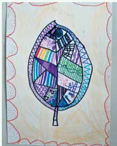
Živa Jeralič, 3. a