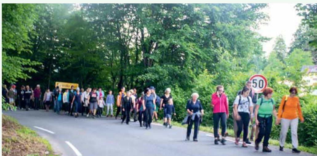
Varno po cesti