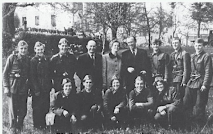
Prvih 10 let