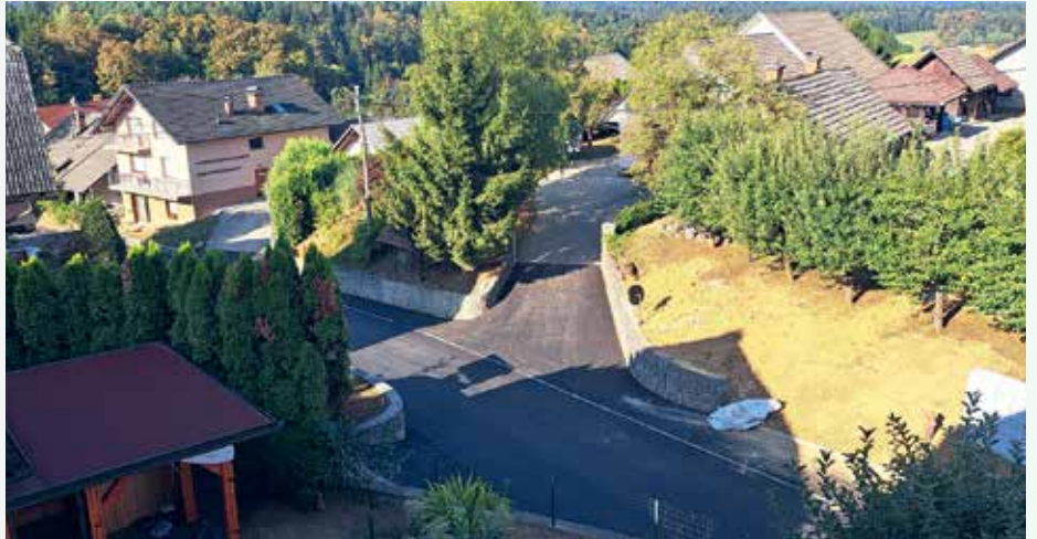
Vrh pri Ljubnu

leto ob prazniku KS, to je v maju, izdamo časopis, ki je enoletni pregled dogodkov KS in utrip krajev.