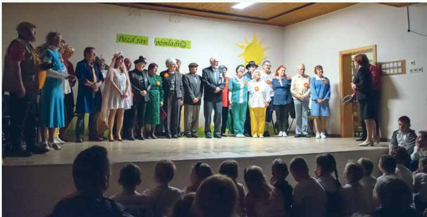
Skoraj premajhen oder za vse...