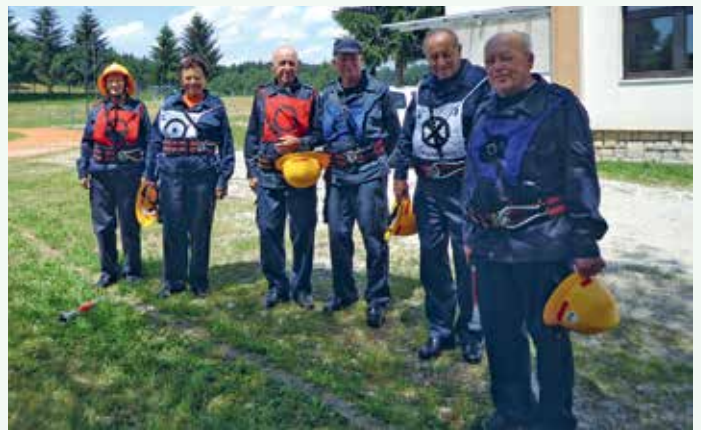
Avtorally 2013 – veterani