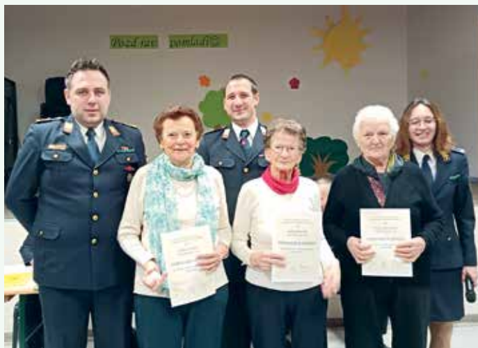
Ustanovne članice na občnem zboru 1. 2. 2025