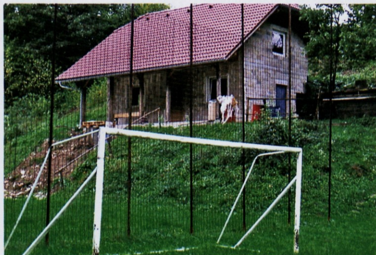
Naša hiša čaka na zaključno fazo.

Lani in letos smo organizirali nogometni turnir v Dragah. Ta turnir je tradicionalen iz prejšnjih let. Oba turnirja sta dosegla pričakovanja članov tako na finančnem kot tudi na organizacijskem področju.