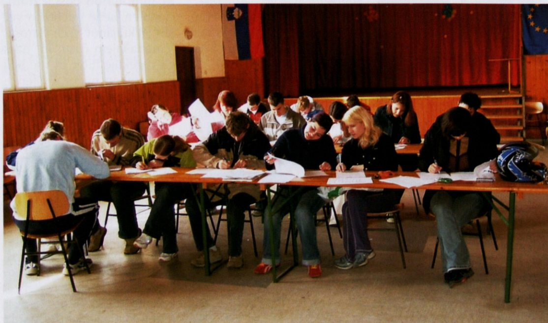
Testi na osnovnem tečaju za gasilce