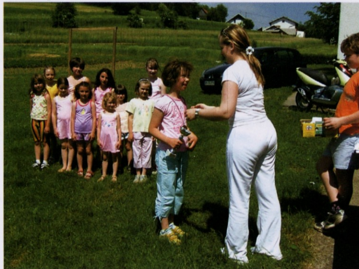
Podelitev medalj tretje uvrščeni ekipi pionirk na tekmovanju GZ Novo mesto

udeležili gasilci pripravniki iz Stranske vasi in iz Lakovnic. Ta tečaj je pogoj za vsa ostala izobraževanja na področju gasilstva.