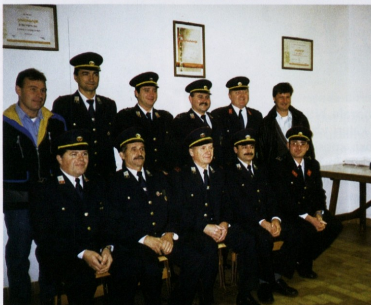
Veseli podljubenski gasilci