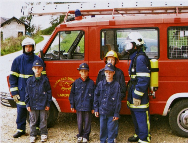
Naš gasilski podmladek