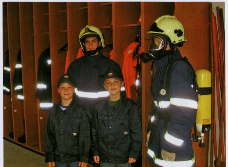
Mladi gasilci se privajajo na nošenje gasilske obleke in opreme