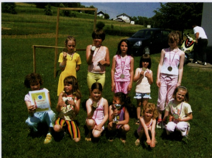
Ekipa pionirk s pokalom in medaljami za 3. mesto.