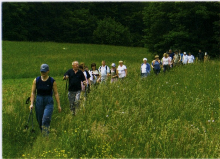
Prvemu postanku naproti – Stranska vas