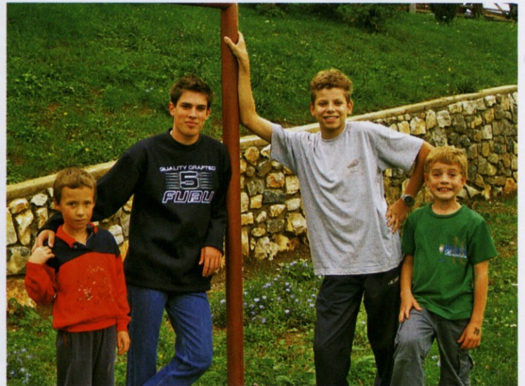
Mladi na novem igrišču – želijo si kakšno igralo, zdaj imajo samo gol