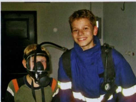
Naš podmladek je navdušen nad privajanjem na gasilsko opremo