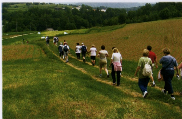
Pogled na Rakovnik