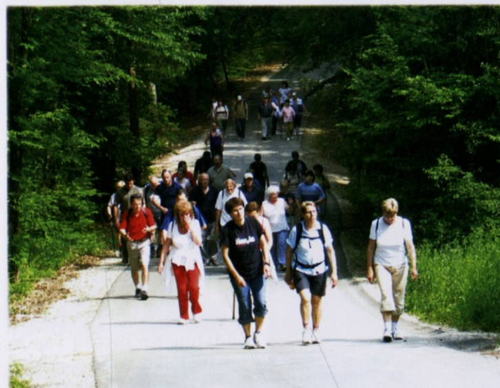
Po postanku ob prepadni